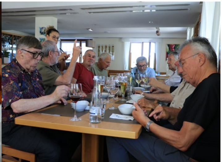
Pickel, Lago, Gambit, Hit, Blasius, Turm, Ohm