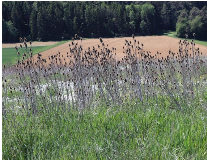
Fruchtflächen – Diversity