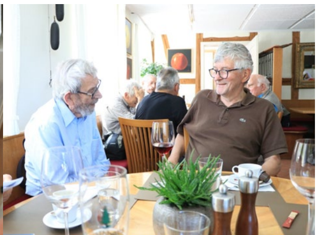
Blasius und Poly