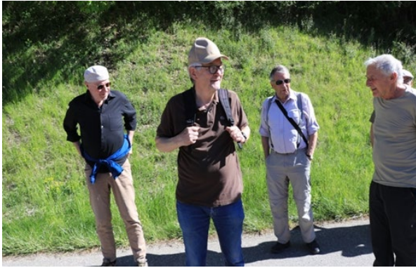
Schlender, Poly, Turm und Hit