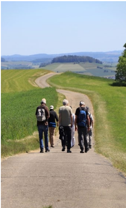
von hinten knapp identifizierbar