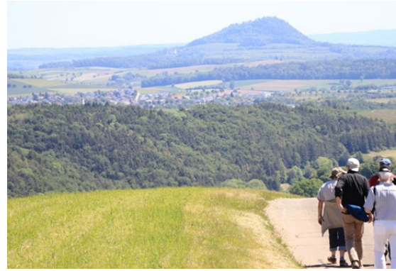
Welcher Höhen ist den das?