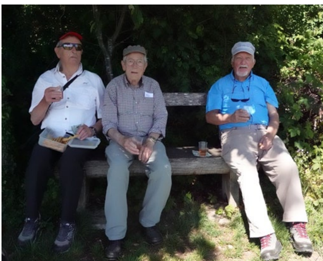
Auch die Kurzwanderer lieben den Schatten: Zahm, Waldi, Hassan und Silo