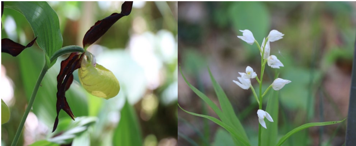
Das Ziel der Wanderung, der Orchideenweg im Tannbüel