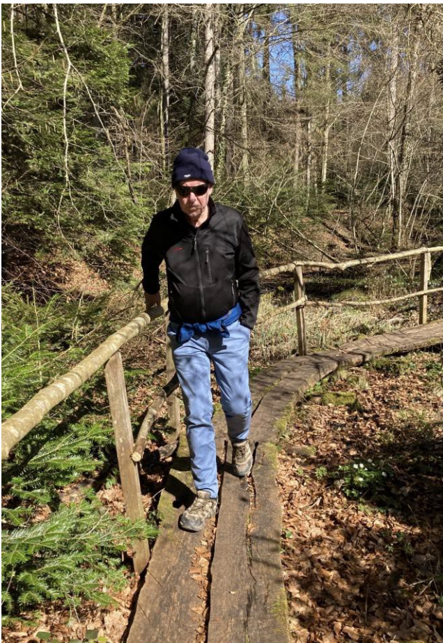
Links: Schlender auf dem romantischen Plankenweg