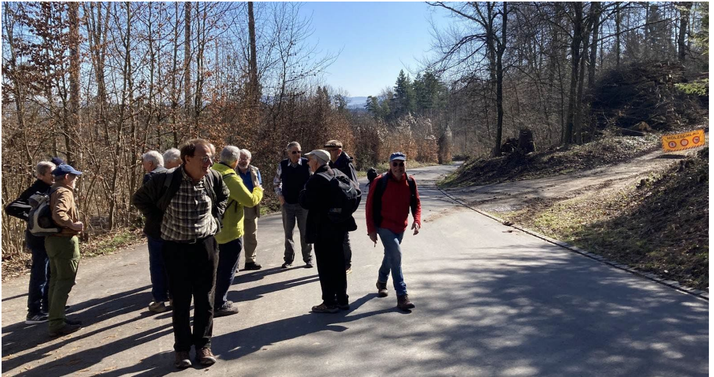
Warnung vor Holzschlag: Filou, Schlender (verdeckt), Lago, Hit, Clever, Saldo, Tramp (verdeckt), Moses, Volpe, Turm, Batze, Poly, Gambit