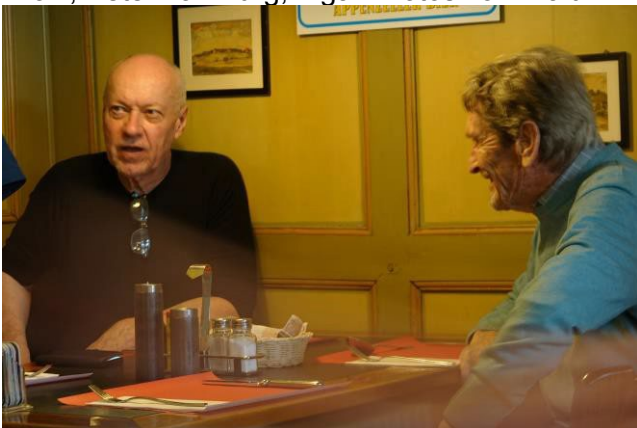
Schlender und Filou