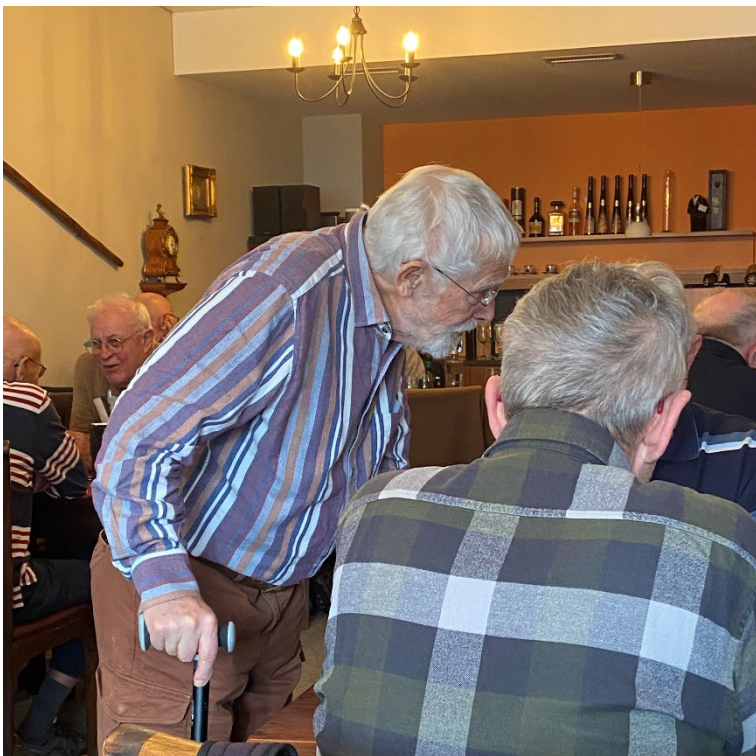
Der Organisator: Drill