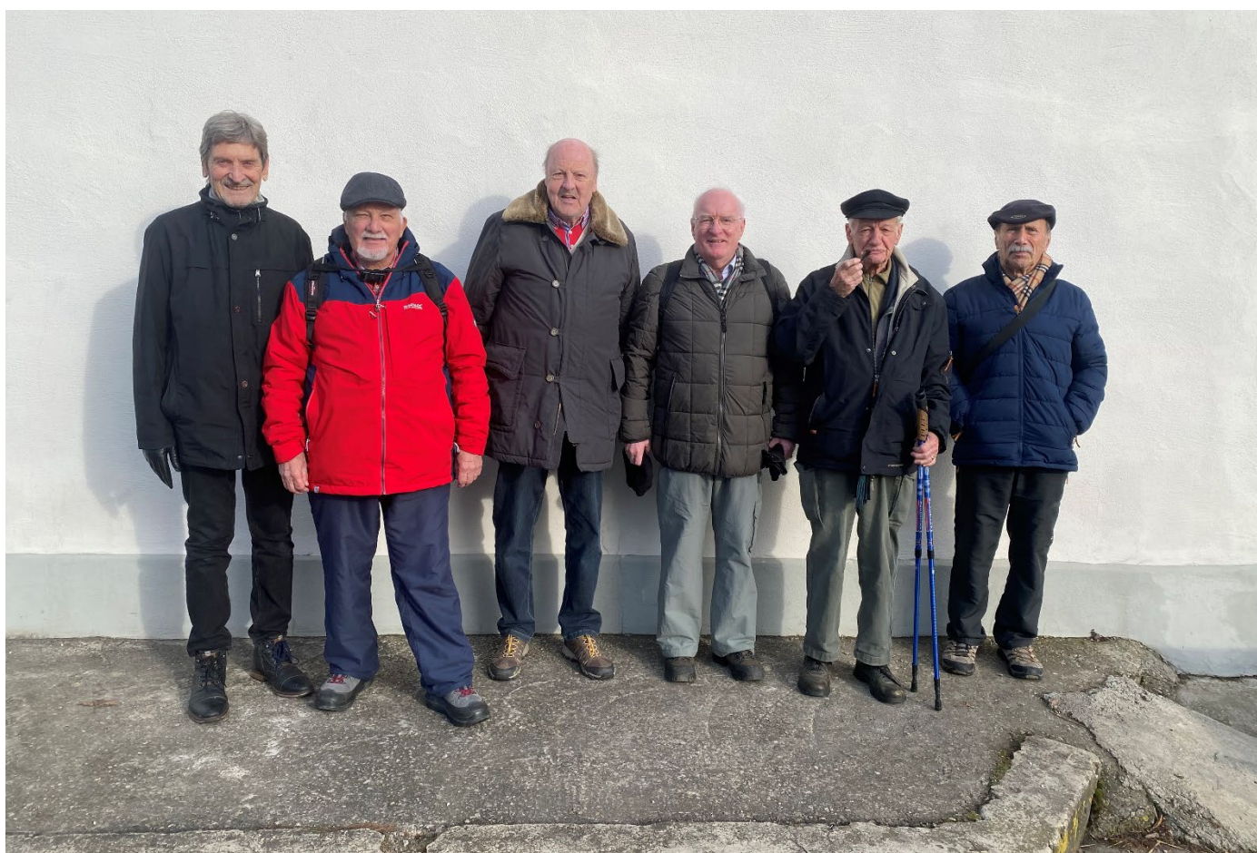
Gut aufgestellt die Kurzwandergruppe Filou, Hassan, Hupf, Zäckli, Diogen und Sog.