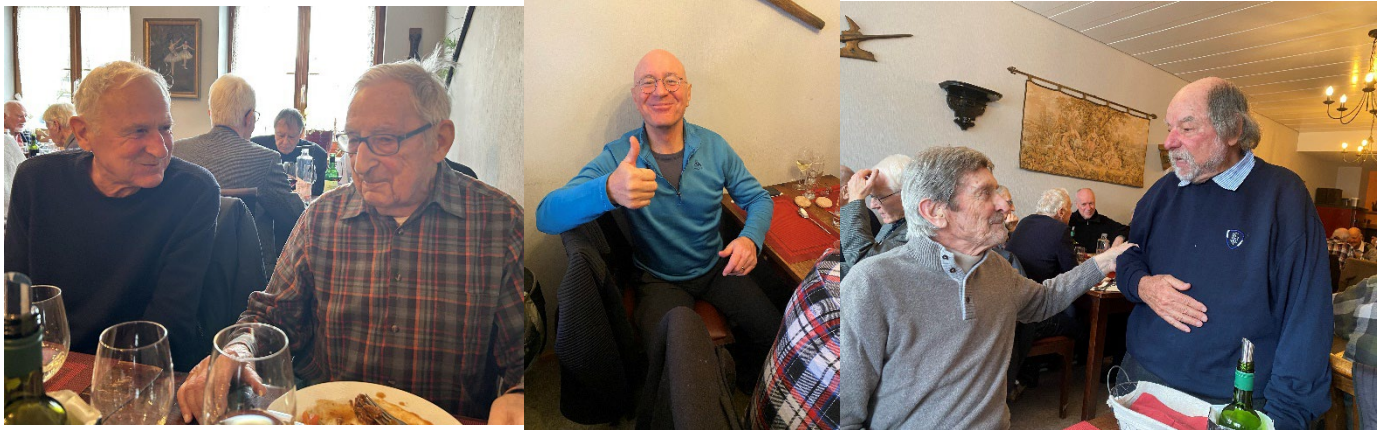
Hit, Muus, neu dabei Zirkel, Filou und Luuser. Unten Wiiguetzli von Zäckli.