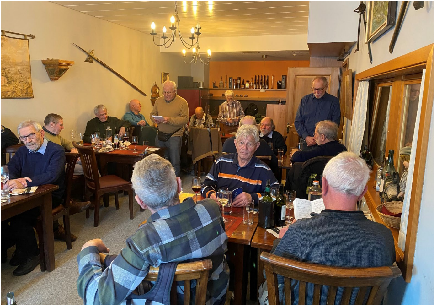
Der Generationencantus 1972 tönt durch den Saal der Wirtschaft zum Haumesser.