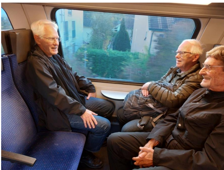
Blend, Chärnli, Filou

16 gutgelaunte Wanderer sind um 08:46 mit der S12 nach Winterthur gefahren. Der wohl kürzeste Weg zum Bahnhof hatte unser Wanderfreund Zuber, der in Dachsen zugestiegen ist. Ab Winterthur begleitete auch Zäckli die Wandergruppe.