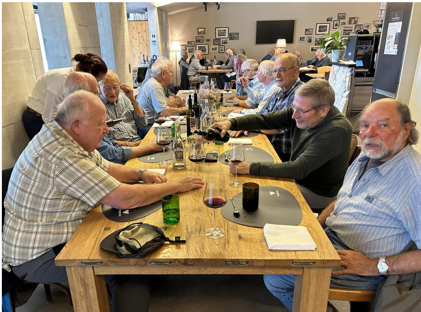
Eingeschenkt werden Osterfinger: Himmelrich und alte Rebe von Richli sowie Nero Cuvée von Stoll zu