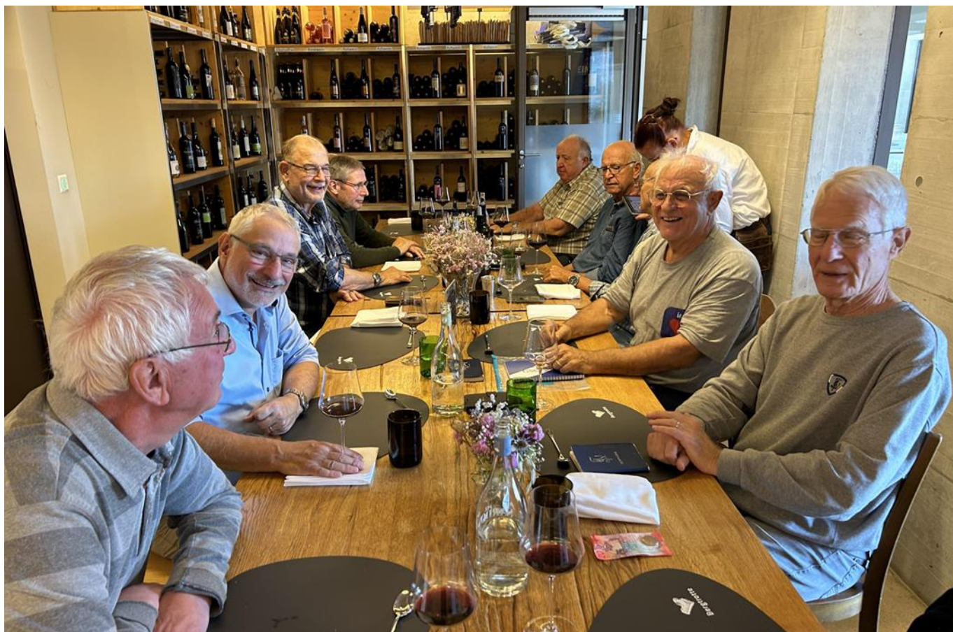
Rieslingsuppe, Hackbraten an Pinot noir-Sauce, Kartoffelstock, Gemüse und Weinguetzli zum Kaffee.