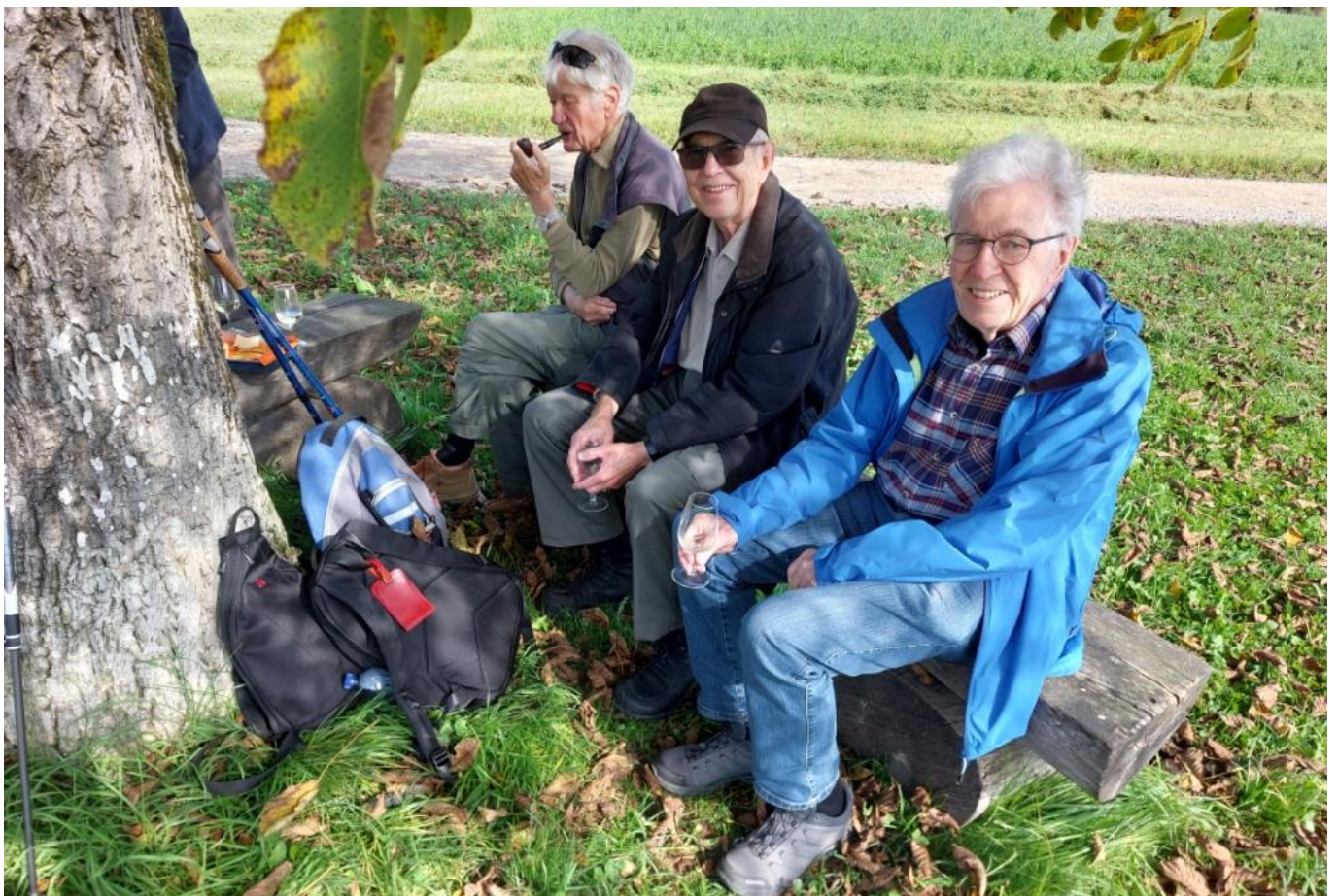
Hit, Stramm, Diogen, Silo und Pfahl geniessen den Apéro-Halt.