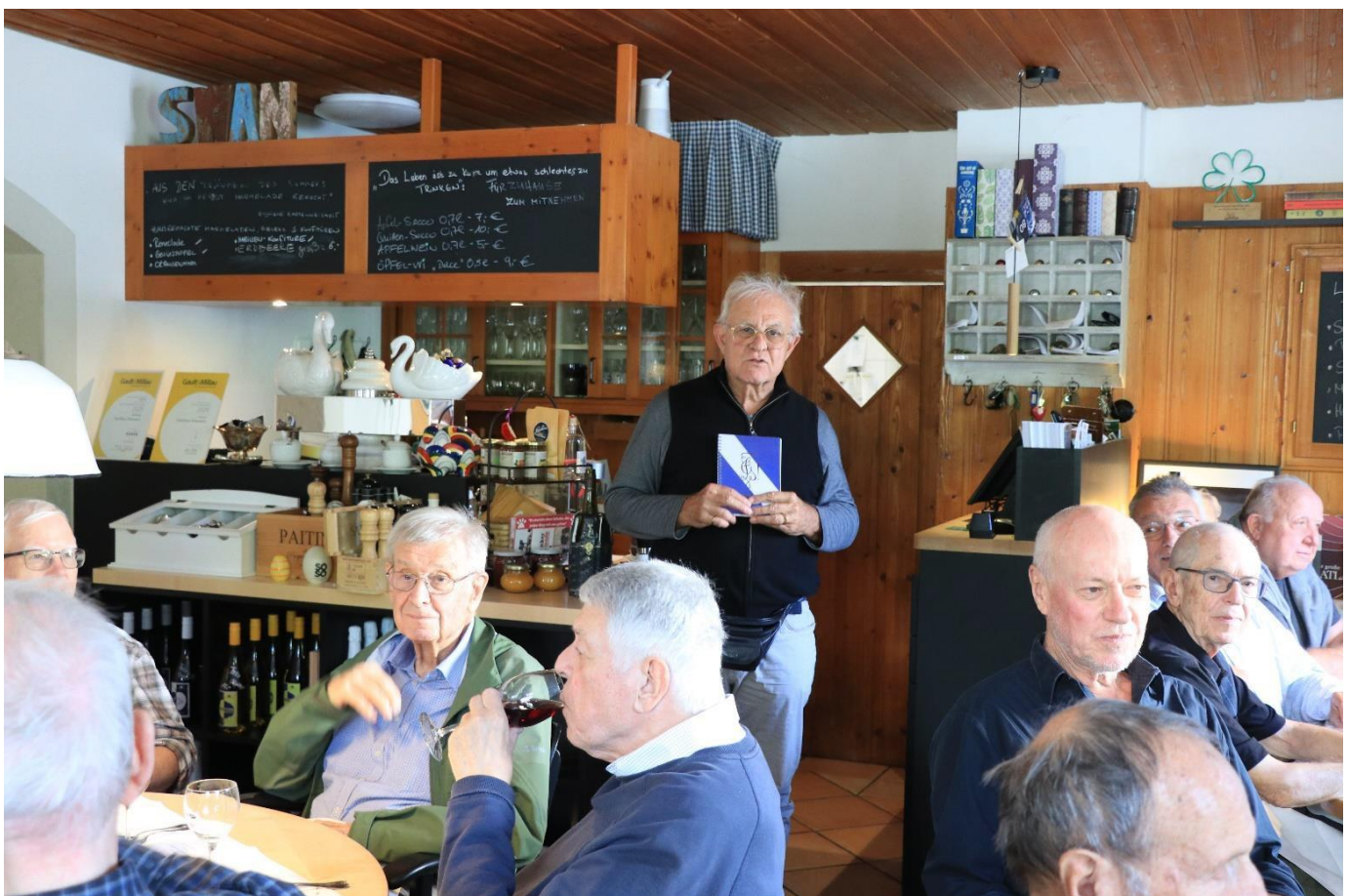
Profil stellt den neuen Kantusprügel vor, der nun bestellt werden kann. Danke für die grosse Arbeit.