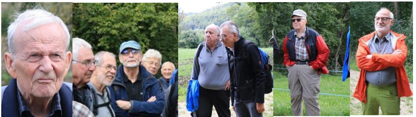
Rubin, Zuber, Lago, Schärbe, Laser, Hit, Pepone, Ohm, Chärnli, Trösch – aufmerksame Zuhörer.

Arcus, Banner, Blasius, Callus, Chärnli, Clever, Clou, Divico, Drill, Hit, Hupf, Lago, Laser, Luuser, Moses, Ohm, Pepone, Profil, Rubin, Sancho, Schärbe, Schlender, Silo, Sog, Stramm, Strubel, Tramp, Trösch, Zahm, Zigan, Zuber.