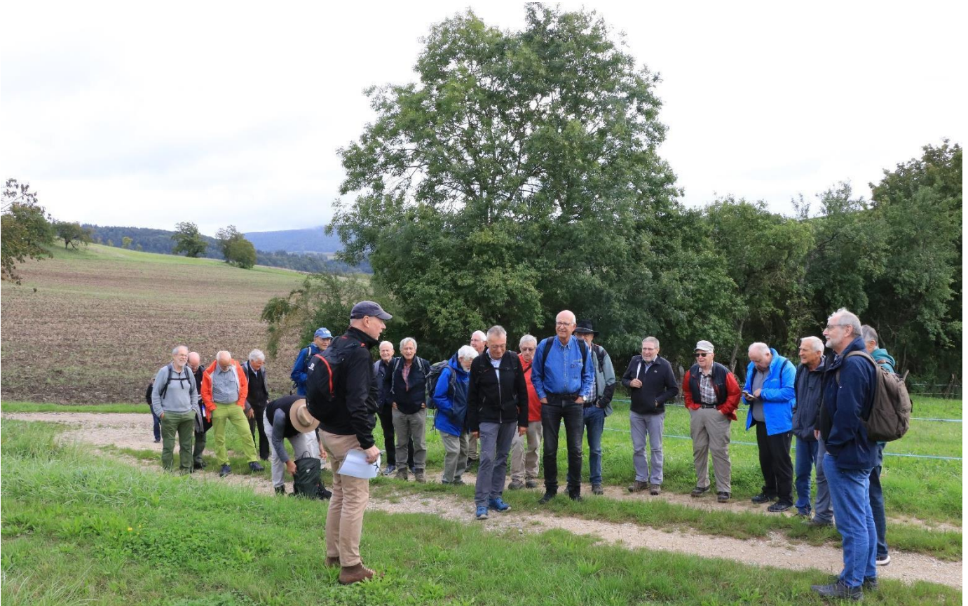
Begrüßung der Langwanderer im Schleithemer Groofedel.

Anfahrt der Langwanderer mit dem Bus nach Schleithem, durch das steile Tal des Grafen von Hohen Lupfen (Groofedel) hinauf zur Hohlenach, zum Mittelbuck und hinab zum Wiizemersteg.