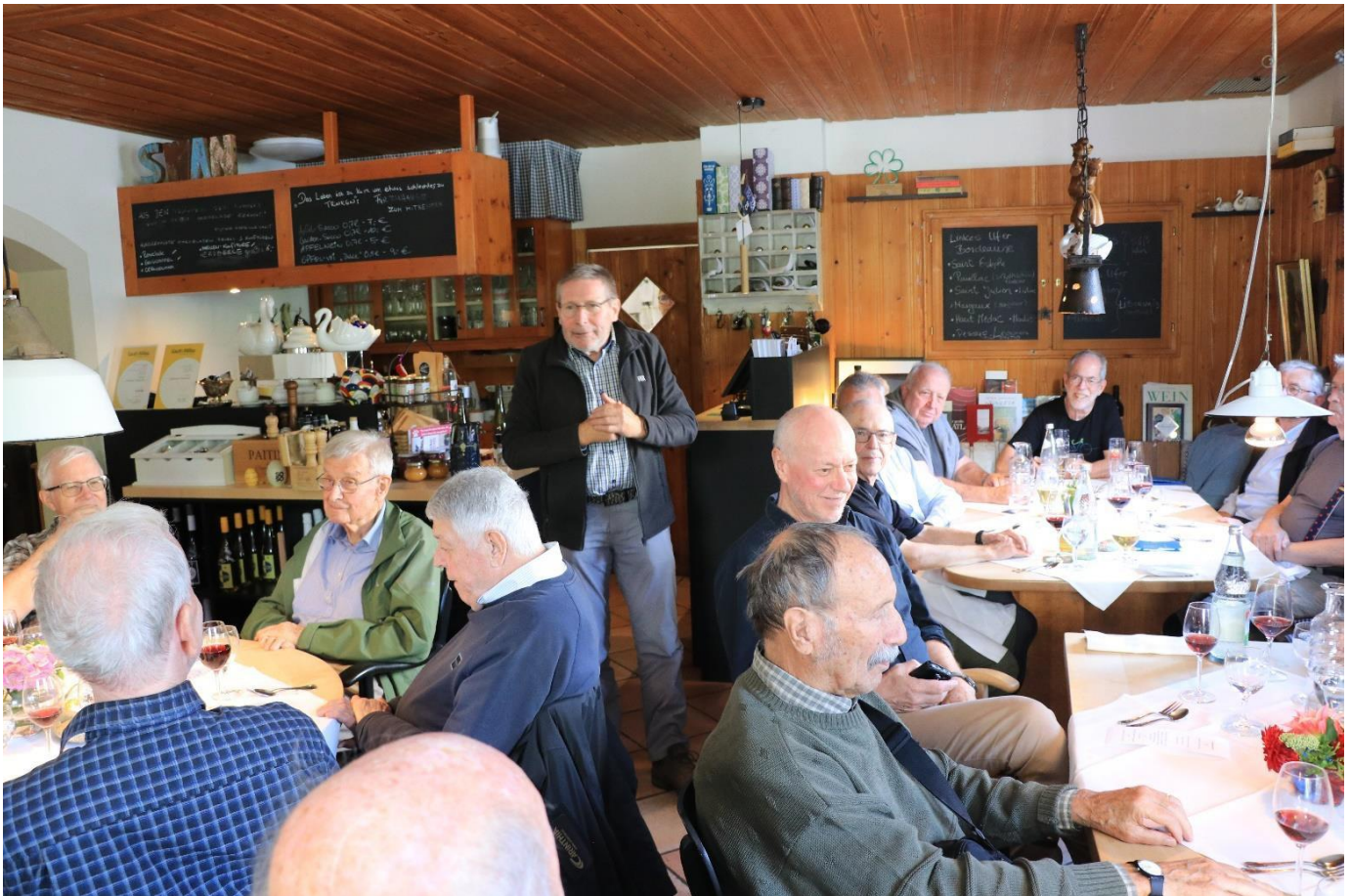
Banner erinnert an die Hochzeit von Divico im Schwanen, ein grandioses Dorffest, und an seine aufgeschlitzten, am lüpfigen Tanz hindernden Hosen.