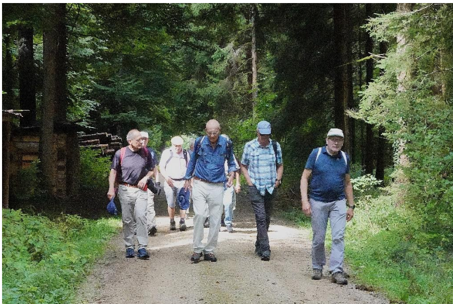
Unterwegs zum Gipfel