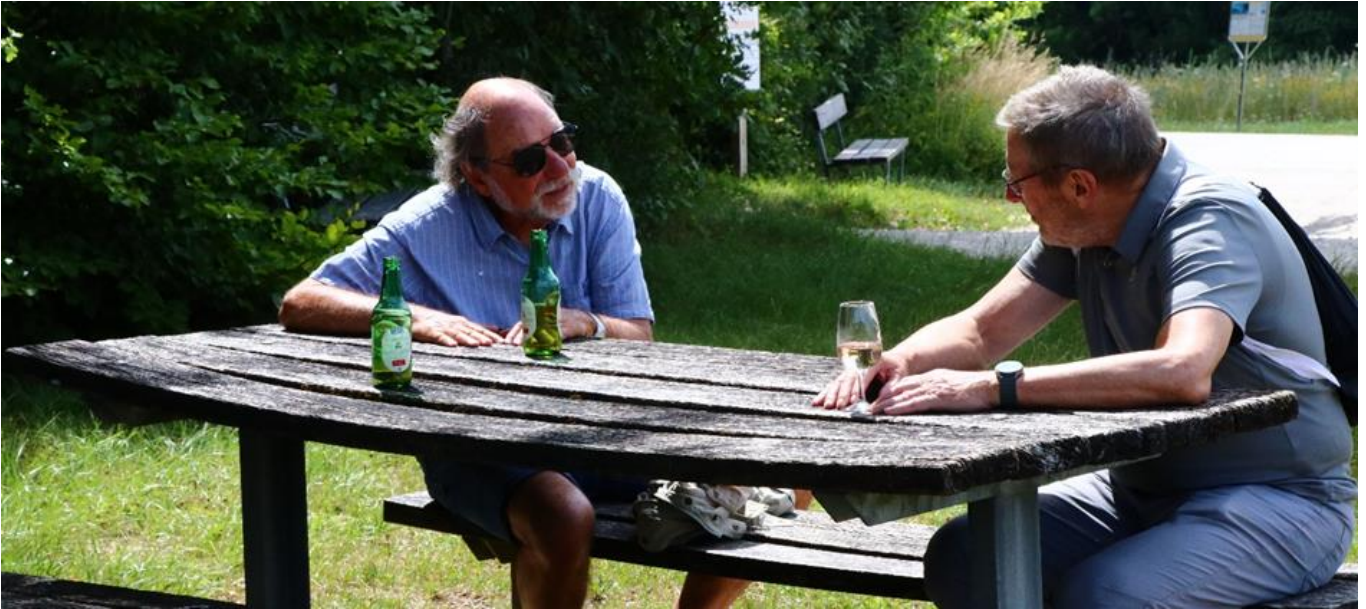
Luuser und Banner