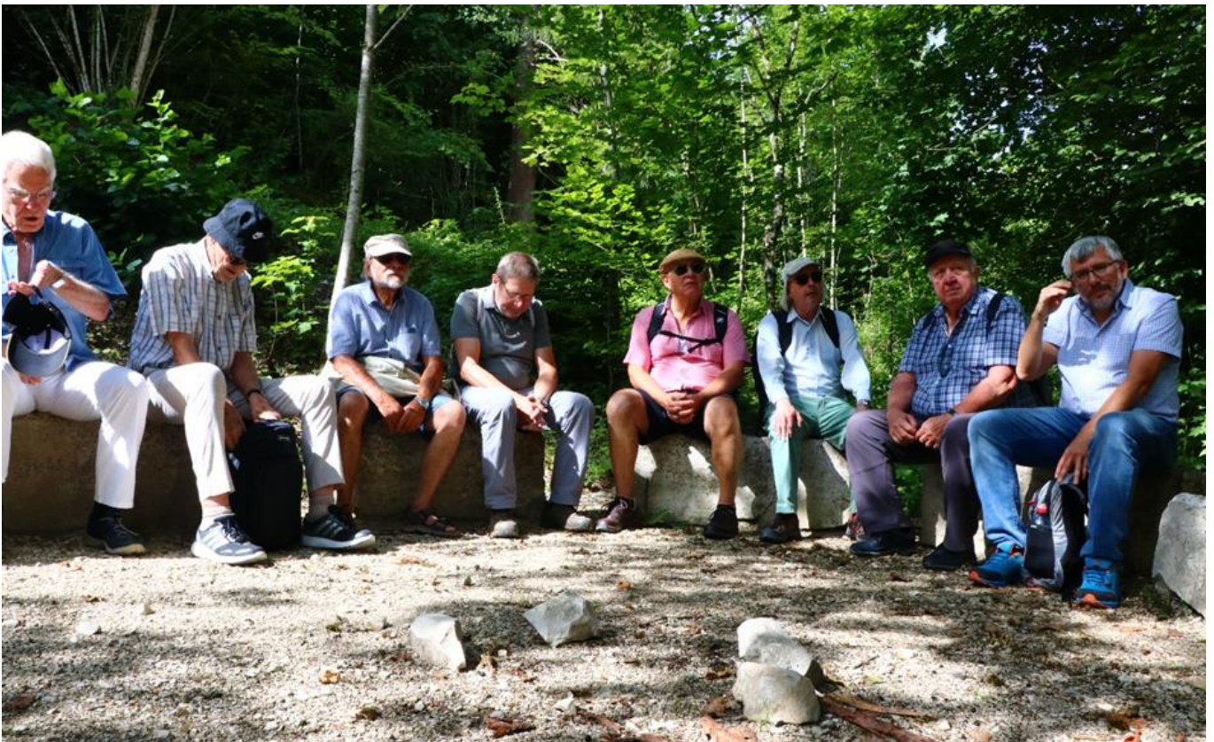
Die Langwanderer Blind, Filou, Luuser, Banner, Profil, Batze, Pepone und Pfad bei der Täuferquelle