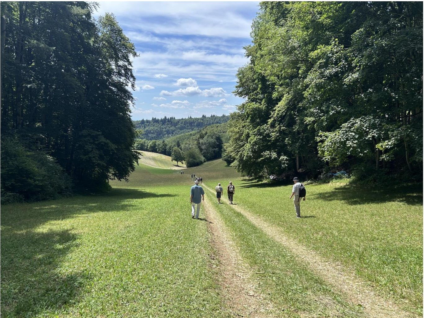
Abstieg zum Süüstallchöpfli