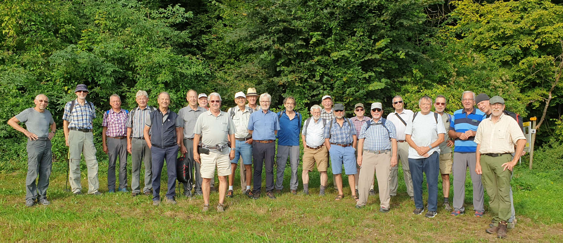
Goliath Pegel Ohm Laser Ready Vino Rugel Zingg Arcus Speiche Glenn Neptun Drill Chlotz Luuser Chärnli Hassan Turm Strubel Kardan Bison Schlender Lago