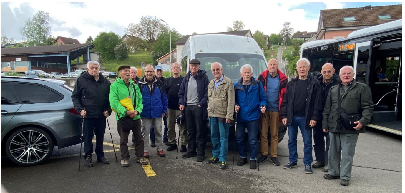
Die Kurz- und Esswanderer am Treffpunkt beim Busdepot in Schleithem

Achdorf liegt dort, wo die alte Feldbergdonau vor rund 20'000 Jahren von der Urwutach angezapft und in einem scharfen Rank zum Rhein umgelenkt wurde. Der wilde Fluss hat sich dabei in einen 180 Meter tiefen Canyon eingegraben. Um 1500 stand in Achdorf ein herrschaftlicher Hof mit Mühle, Drechslerei, einer Brauerei, die bis 1905 Bier herstellte, und mit einer 1543 erstmals erwähnten Taverne. Den Namen Linde erhielt sie 1651, als die Talbewohner aus Dankbarkeit über die Beendigung des schrecklichen Dreissigjährigen Krieges vor dem Haus eine Linde pflanzten. Josef Victor Scheffel (1862-1886), einer der volkstümlichsten deutschen Dichter, zudem Hofbibliothekar in Donaueschingen, unternahm immer wieder lange Wanderungen durch den Hegau, die Baar und das Wutachtal und hielt sich zu «unbeschwerten Stunden in der Linde zu Achdorf» auf. Nach Scheffels Tod gab sich das Gasthaus den Namen «Scheffellinde», das Ziel der Wandergruppe der Alt-Scaphusia im Mai 2023.