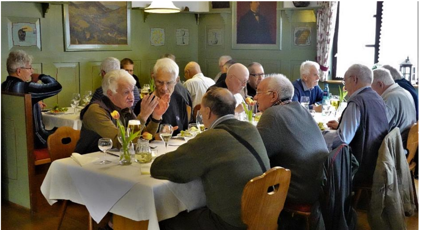
Angeregte Gespräche beim Mittagessen in der Scheffellinde