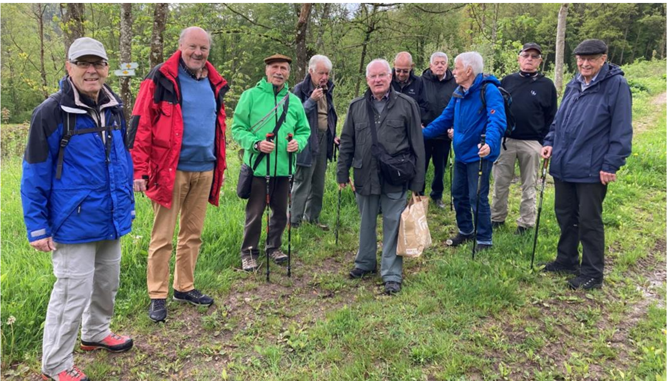
Gruppenbild der Kurzwanderer

Die Esswanderer halfen dem Busfahrer das Gasthaus zu finden.