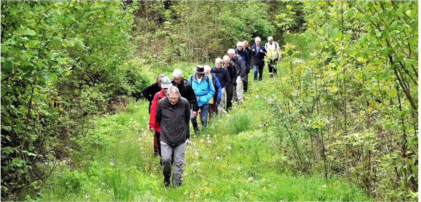
Die Langwanderer auf dem Weg zur Eisenbahnbrücke über die Wutach, aufgenommen von Waldi

Die Langwanderer folgten der Wutach hinauf von Grimmelshofen durch die Wutachflühen nach Achdorf – mit einem Apéro bei der ehemaligen Moggerenmühle, die 1891 durch ein Hochwasser zerstört wurde. Die interessante Geologie zeigte sich an den schlüpfrigen Gesteinsschichten und sorgte für dreckige Schuhe, die allerdings auf dem «Wellblechsträssle» wieder abgeklopft werden konnten. Der Regen hielt sich vornehm zurück.