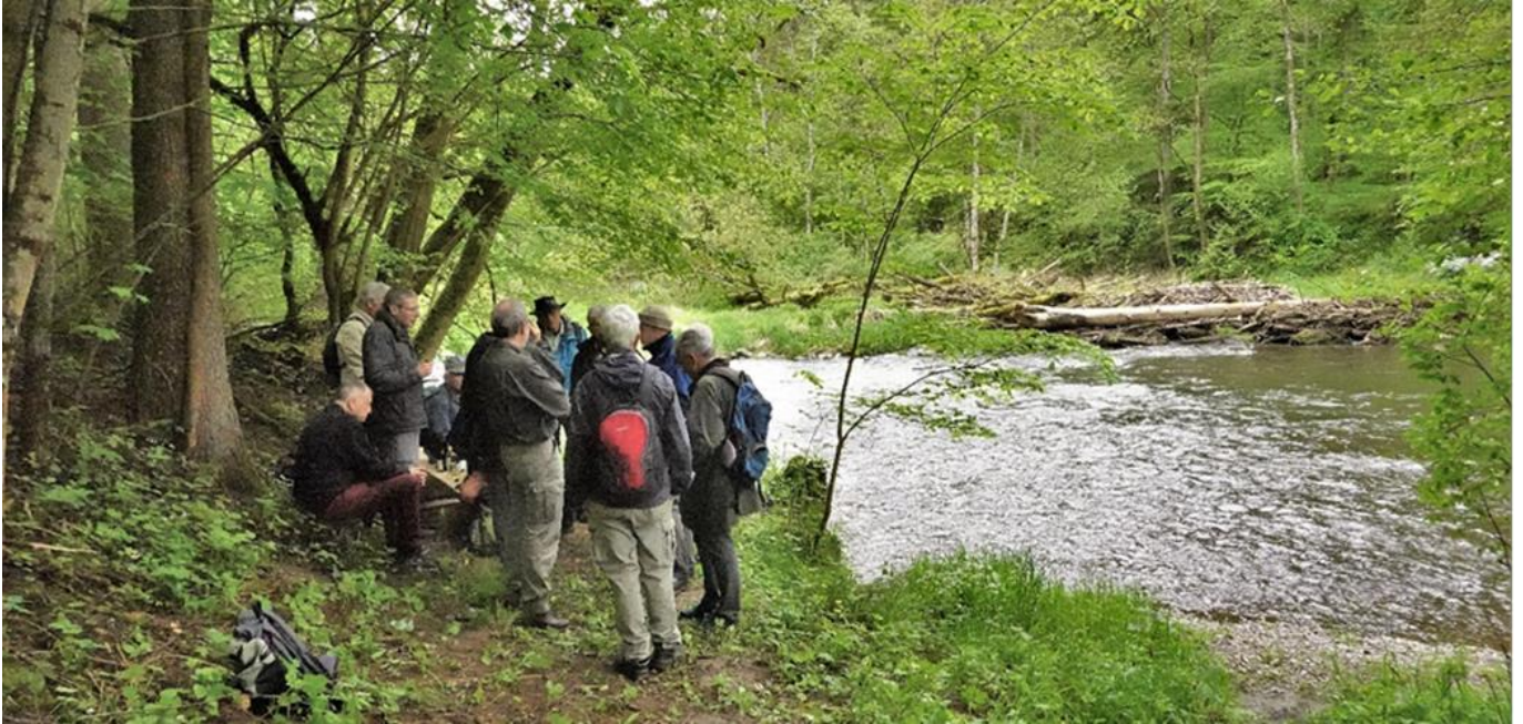
Apéro der Langwanderer bei der ehemaligen Moggerenmühle