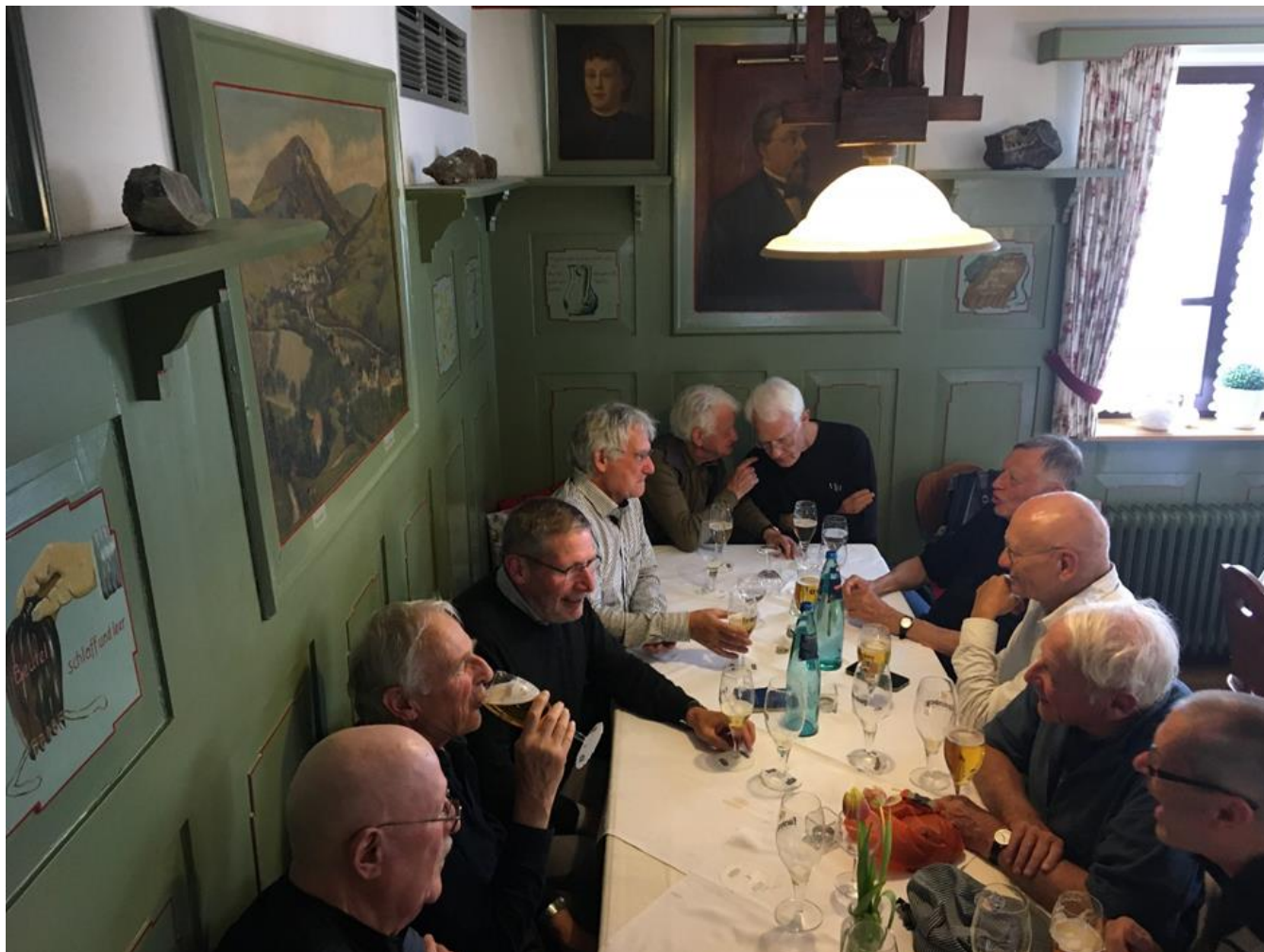
Die Nachzügler warten gelassen auf den Bus

Es war eine muntere «Auslandexpedition», dank Zuschuss aus der BÜSlikasse. Der Tag lässt sich gut zusammenfassen mit den Worten Scheffels in der Novelle «Juniperus» um 1860: