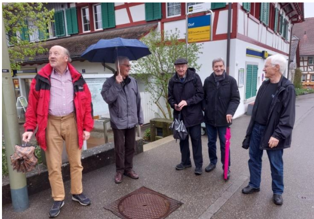
Start Kurzwanderer: Hupf, Delphin, Zigan, Filou und Blind.

Die 6 Kurzwanderer fuhren mit dem Bus von Marthalen nach Benken und starteten unter der Leitung von Blind auf Hinterpfaden durch das Dorf und über die Steigstrasse in die Benkemer Reben. Obwohl der Freiluft-Apéro abgesagt war, hatte Strubel eine Flasche Weisswein im Rucksack, welche bei einer Reblauben einigermassen trocken genossen werden konnte.