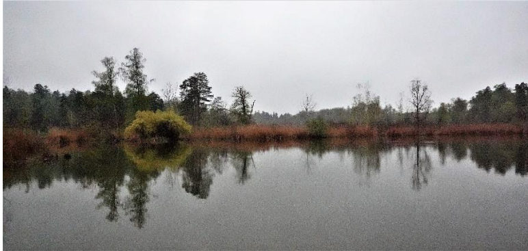
Die See- und Riet-Landschaft.

Nach einigen hundert Metern südlich der Seen führte der Weg über Trampelpfade, Holzstege und kleine Brücken mit beidseitiger Sicht auf die See- und Moorlandschaft zur Nordseite des Sees, mitten ins Naturschutzgebiet. Die reichlichen Niederschläge der letzten Wochen hatten die Wege teilweise unter Wasser gesetzt, gutes Schuhwerk war hier von Vorteil.