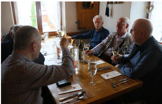
Sec, Figaro, Homer und Plausch beim Apéro.

Trotz Apéro-Pause sind die Kurzwanderer nur einige Minuten nach den Langwanderern im Restaurant eingetroffen. Der Wanderleiter begrüßte die ganze Corona und gab seiner Freude über das vollzählige Erscheinen trotz miesem Wetter Ausdruck. Es wurde nun bis 13 Uhr der unterwegs verpassten Apéro mit Bier vom Fass, Rudolfinger RieslingxSilvaner und Blauburgunder ausgiebig nachgeholt.