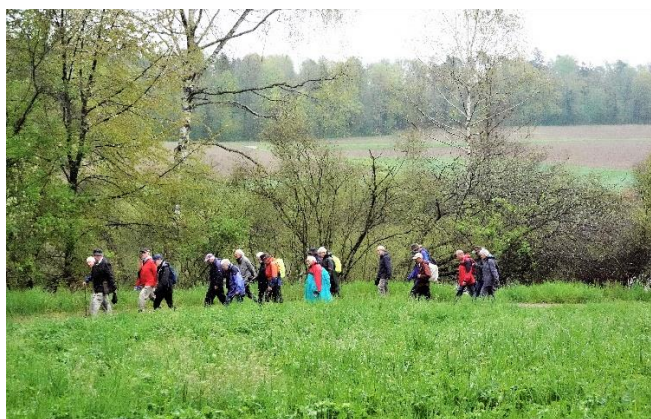
Im Anmarsch zur See-Landschaft.

Nach kurzer Begrüssung und Information durch den Wanderleiter zog die Truppe los Richtung Kastellhof und Husemer See. Der Regen liess langsam nach, sodass im Bereich der See-Landschaft wenigstens die Schirme zugeklappt werden konnten.