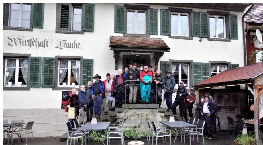
Gruppenbild der Langwanderer vor dem Tagesziel: Sancho, Lago, Clever, Tramp, Zahm, Pfahl, Drill, Sec, Turm, Hassan, Arcus, Laser, Poly, Batze, Gump, Pirat, Kiel, (verdeckt: Schuss und Hit).

Unter wieder einsetzendem Regen wurde die 2. Hälfte der Wanderung über das freie Feld absolviert. Kurz vor halb eins wurde das Ziel Rudolfingen erreicht. Nach Waldi's Gruppenfoto auf der Treppe des Restaurants Traube ging's rein in die Gaststube, wo bereits unsere 4 Esswanderer am Apéro waren.