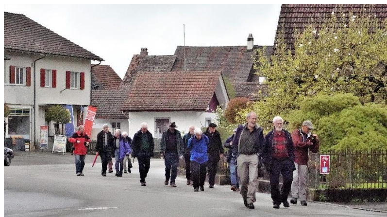
Abmarsch zur Heimreise.

Kurz vor 15.30 Uhr wurde die Quote geschlossen, berechnet und die fälligen Fr. 55.- (grosszügiges Trinkgeld inbegriffen) einkassiert. So reichte es problemlos auf den Bus 15.50 Uhr nach Marthalen und dort auf die Züge nach Schaffhausen und Zürich. Allerdings blieb über ein Drittel der Teilnehmer noch für einen längeren Nachtrunk im Aussenbereich des Restaurants; einige nahmen den Bus 16:50, wieder andere 17:50 (so auch der Berichterstatter), aber ein harter Kern blieb auch dann noch sitzen.