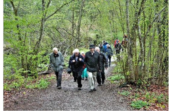
Die Truppe unterwegs durch das Naturschutzgebiet auf teilweise überschwemmten Wegen.

Nach einer knappen Stunde Wanderzeit und Kurzbesichtigung eines Biberdammes wurde der Badeplatz am nordöstlichen See-Ende erreicht. Da der hier vorgesehene Apéro wetterbedingt entfiel, wurde nur kurz angehalten und dann Richtung «alten Weier» und Bruggbach weitermarschiert.