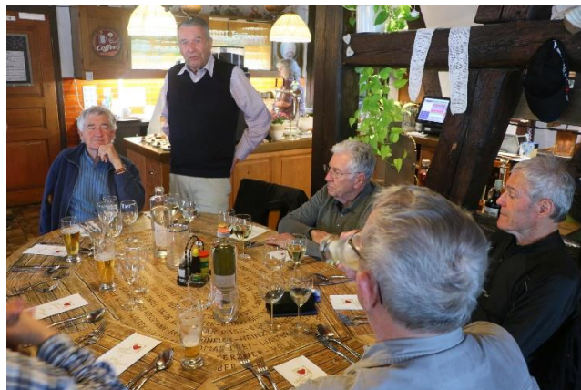
Begrüßung durch den Wanderleiter, flankiert von Clever, Pfahl, Schuss und Zahm.