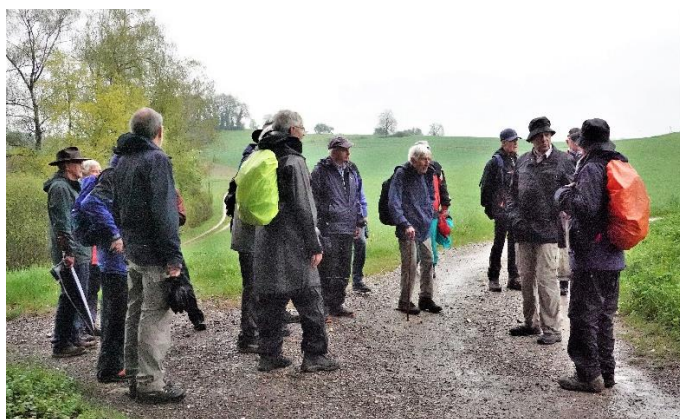
Zwischenstopp mit kurzen Informationen.

Der Wanderleiter erzählt kurz etwas zum Naturschutzgebiet Husemer See: Der See ist ein Toteis-See, der beim Rückzug des Rhein-Bodensee-Gletschers nach der letzten grossen Eiszeit vor rund 12'000 Jahren entstanden ist. Die umliegenden kleineren Weier, teils verbunden mit dem See, sind Mulden, die