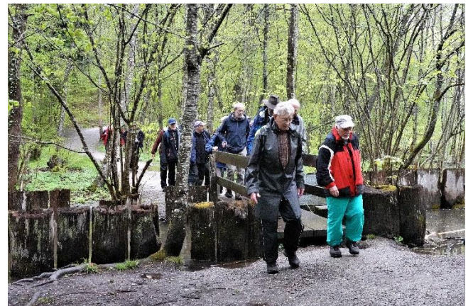
Unterwegs Richtung «zum alten Weier».

Unter wieder einsetzendem Regen wurde die 2. Hälfte der Wanderung über das freie Feld absolviert. Kurz vor halb eins wurde das Ziel Rudolfingen erreicht. Nach Waldi's Gruppenfoto auf der Treppe des Restaurants Traube ging's rein in die Gaststube, wo bereits unsere 4 Esswanderer am Apéro waren.