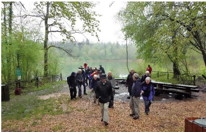
Kein Apéro, Start nach kurzem Stopp vom nassen Badeplatz.

Nach einer knappen Stunde Wanderzeit und Kurzbesichtigung eines Biberdammes wurde der Badeplatz am nordöstlichen See-Ende erreicht. Da der hier vorgesehene Apéro wetterbedingt entfiel, wurde nur kurz angehalten und dann Richtung «alten Weier» und Bruggbach weitermarschiert.