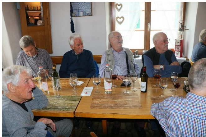
Pirat, Filou, Figaro, Homer und Plausch.