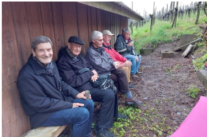
Kurzwanderer-Apéro mit Filou, Zigan, Delphin, Hupf, Strubel.

Trotz Apéro-Pause sind die Kurzwanderer nur einige Minuten nach den Langwanderern im Restaurant eingetroffen. Der Wanderleiter begrüßte die ganze Corona und gab seiner Freude über das vollzählige Erscheinen trotz miesem Wetter Ausdruck. Es wurde nun bis 13 Uhr der unterwegs verpassten Apéro mit Bier vom Fass, Rudolfinger RieslingxSilvaner und Blauburgunder ausgiebig nachgeholt.