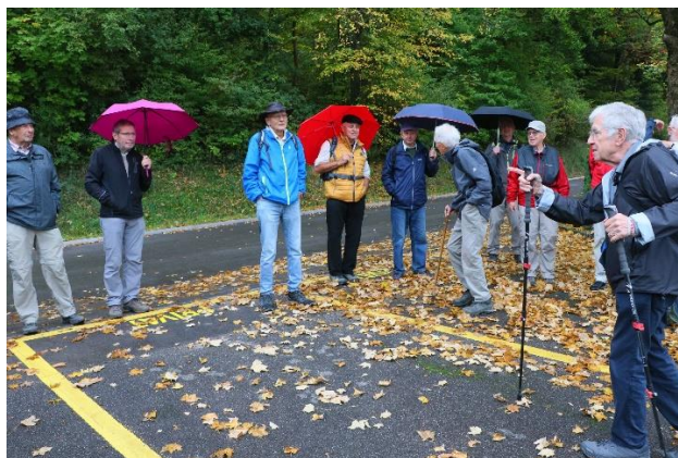
Turm, Banner, Arcus, Profil, Batze, Pirat, Zuber, Chärnli, Pfahl.

Ungeachtet des Nieselregens wanderten wir los und sogleich begannen, wie immer, interessante Gespräche der Teilnehmenden. Auf der Höhe angelangt öffnete sich ein freies Wandergebiet von Bülach, das kaum jemand kannte. Der Wanderleiter traute sich kaum, die intensiven Gespräche zu unterbrechen, doch schien es ihm wichtig, zu zeigen, wie sich die Altstadt vom Bahnhof bis etwas unterhalb der reformierten Kirche erstreckt und sich in allen Richtungen erweitert.