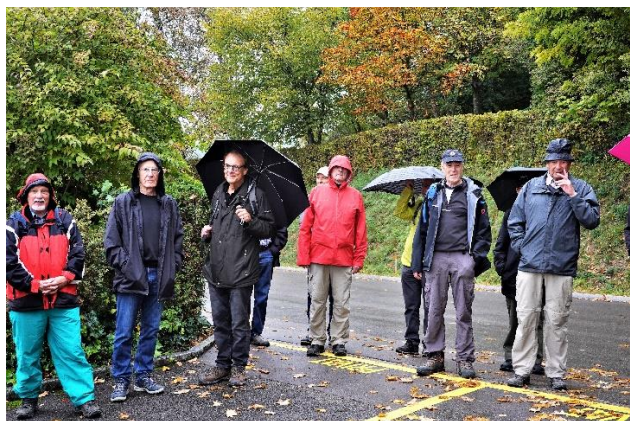
Hassan, Blend, Saldo, Zahn, Schuss, Turm.

Nach den ersten Schritten bergauf begrüßte uns der Wanderleiter. Er erklärte, dass die heutige Wanderung uns aufwärts bis zum obersten Waldrand und etwa auf dieser Höhe nach ca. einer Stunde zum Apéro führt. Zudem zeigte er der Gruppe einen ersten Ausblick auf das kürzlich entstandene neue Quartier Bülach-Nord.