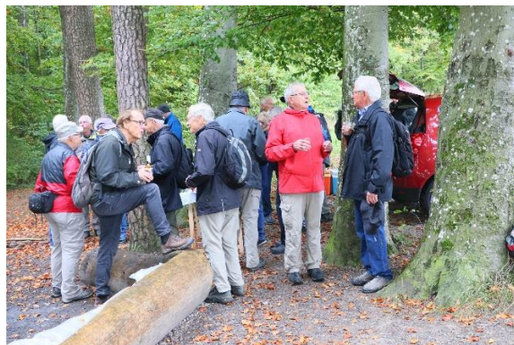
Chärnli, Saldo, Batze, Waldi, Turm, Zahm, Kiel.