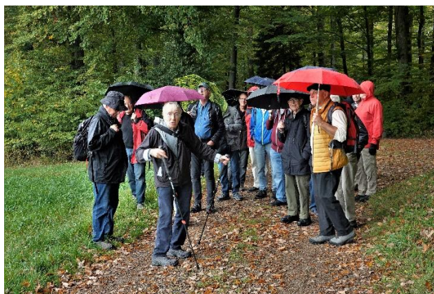
Kiel, Sancho, Pfahl, Callus, Saldo, Silo, Profil.

Die Sicht war etwas verhangen, sodass die Bergwelt heute nicht zu sehen war. Immerhin sah man von den umliegenden Ortschaften bis hin zu den Lägern. Das ab und zu hörbare Geräusch war nicht etwa ein entferntes Donnerrollen, sondern die Musik der Triebwerke der startenden Flugzeuge.