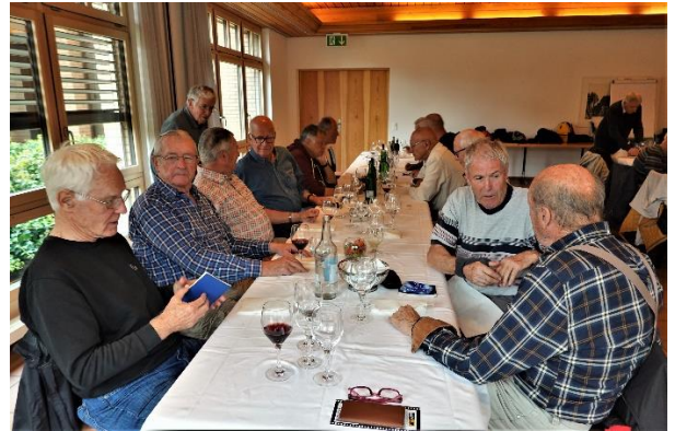
Blend, Zahm, Turm, Pfahl, Callus, Strubel, Sancho, Arcus, Chärnli, Schuss, Hupf.