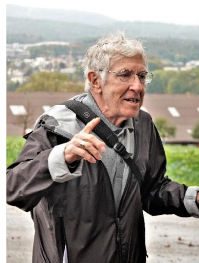
Pfahl, mahnt zum Aufbruch.