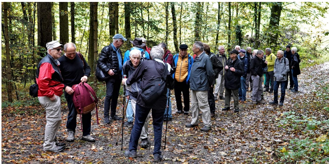
Chärnli, Sancho, Callus, Arcus, Pirat, Pfahl, Strubel, Profil, Turm, Saldo, Zuber, Silo, Kiel, Batze, Schuss, Drill, Banner, Moses, Hit, Schlender, Blend.

Weiter ging es nun mehrheitlich abwärts durch den farbigen Herbstwald. Nach einer weiteren Stunde erreichte die Gruppe das Ziel, den Landgasthof Breite in Winkel um 12:55 Uhr.