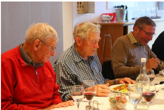
Zigan, Waldi, Banner.