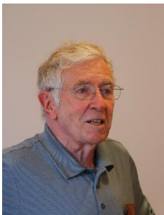
Der Wanderleiter: Pfahl

Um 15:15 Uhr gab der Wanderleiter die Quote von Fr. 55.- bekannt. Er bedankte sich nochmals bei allen Wanderern und beendete den offiziellen Teil des Anlasses. Er wünschte allen eine gute Heimreise.