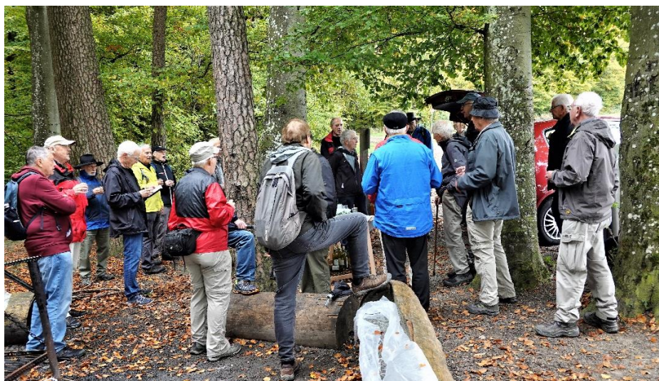
Strubel, Hupf, Drill, Blend, Moses, Schuss, Chärnli, Saldo, Sancho, Pfahl, Profil, Arcus, Pirat, Regine, Callus, Turm, Kiel, Zuber.