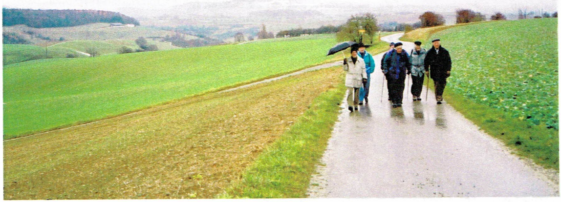
Zusammenhänge mit den Kurg- Wandern. Ganz im Hintergrund die Kermatung des Nohm-Hotfels.