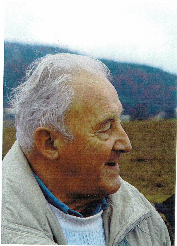
Quay du Reichersbach