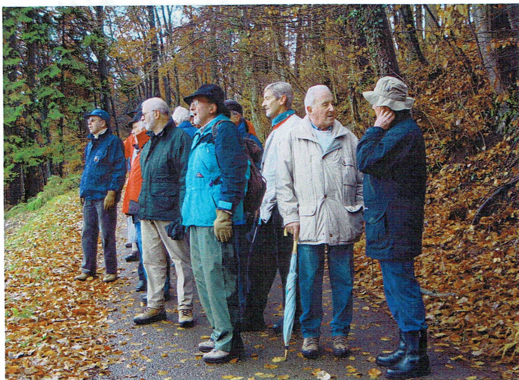
Im Oktober von L. u. P. Christel, Käpf, Fant, Filon und Quas