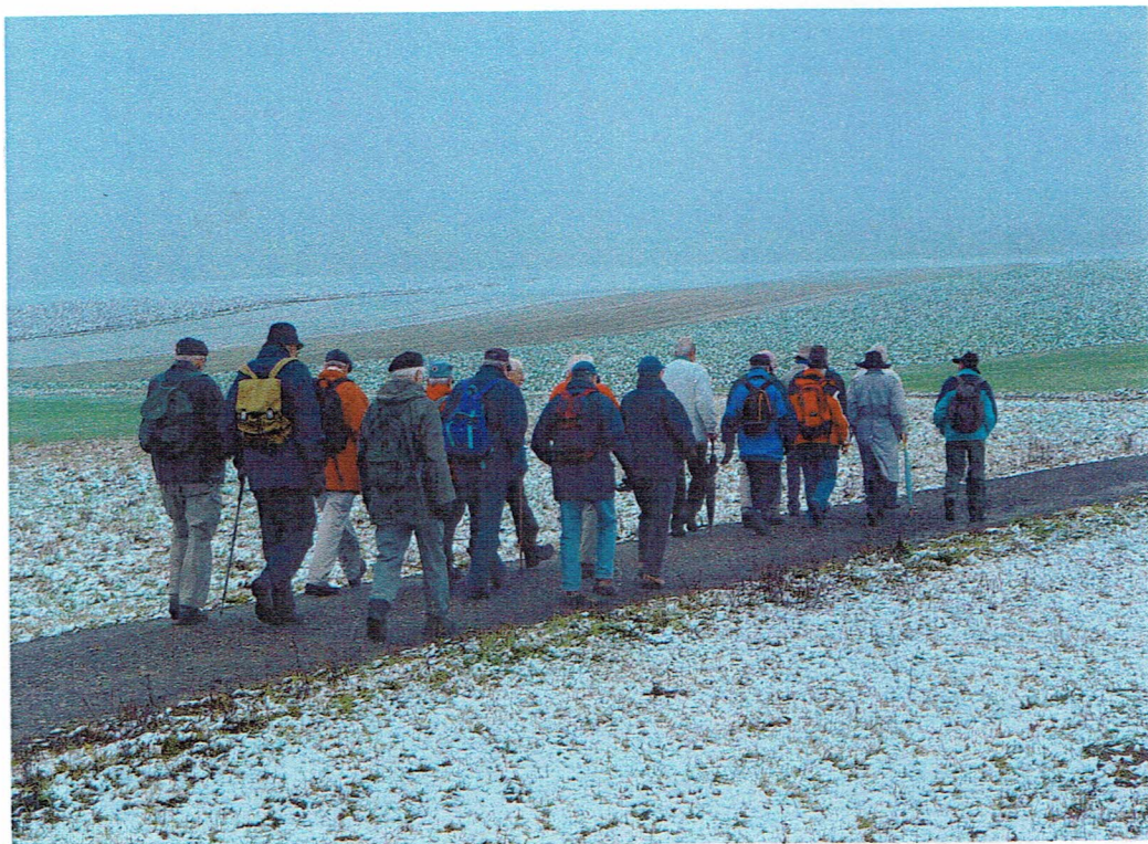
Immer noch auf dem Reiset