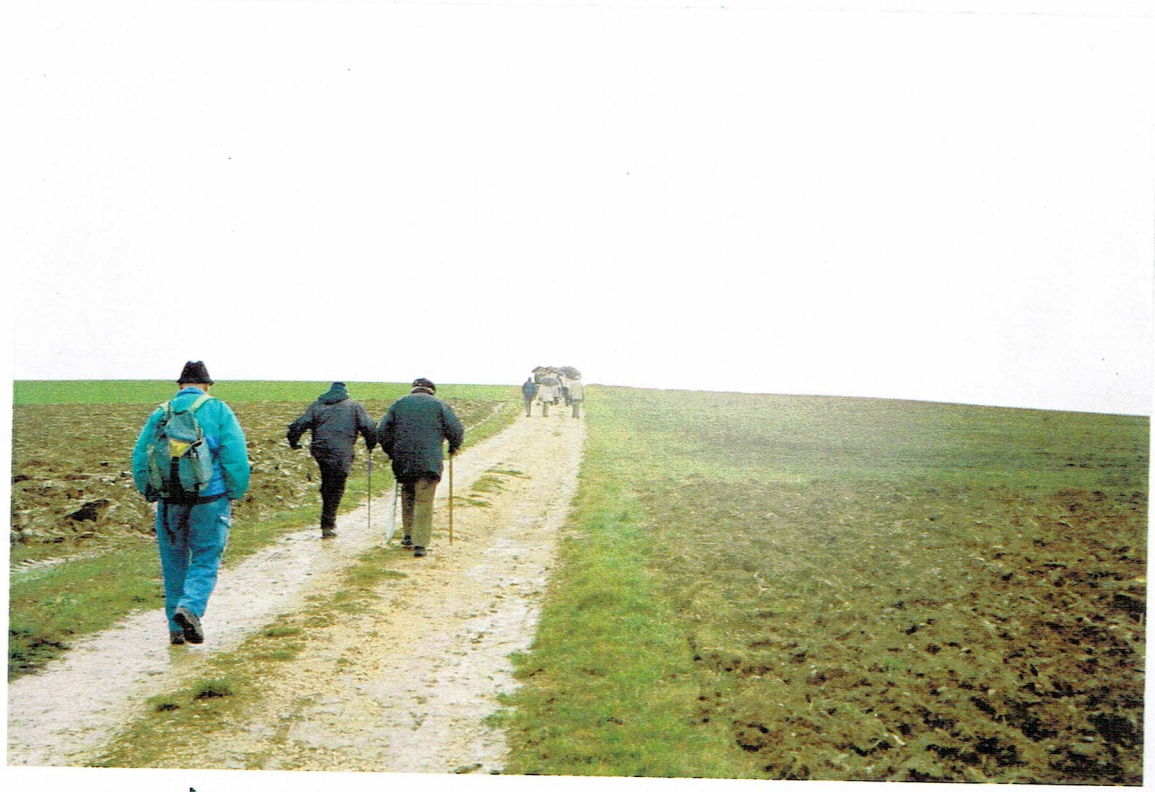
Weiter geht's der Megete ent- fernen