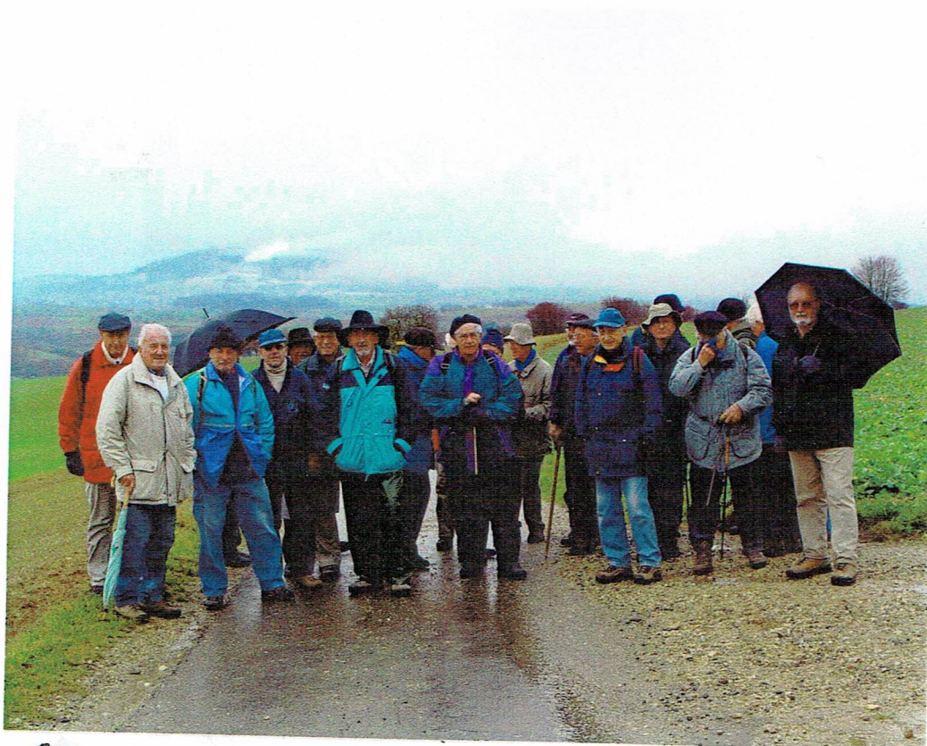
Alle, ausgenommen die Esswenderer