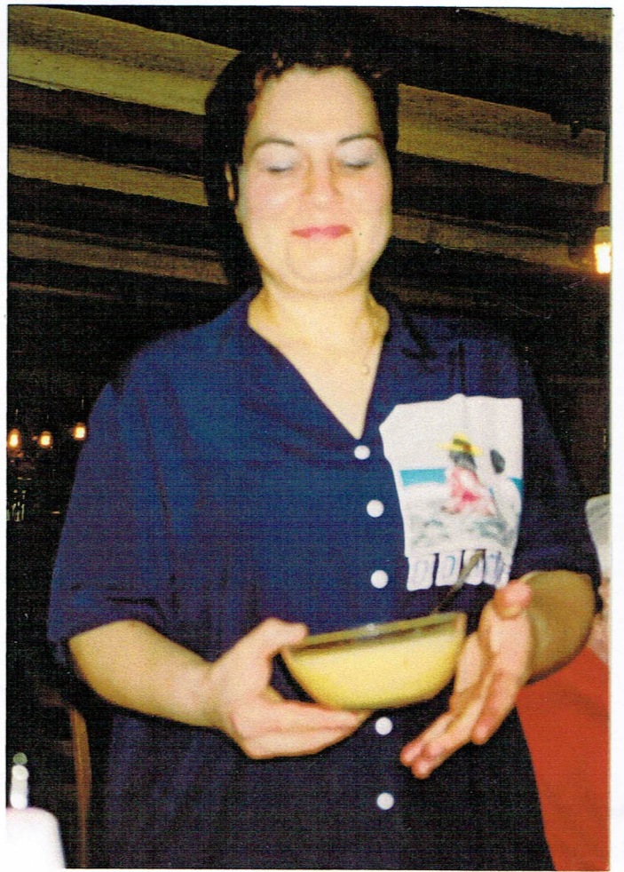
Fleisch und Apfelmus.