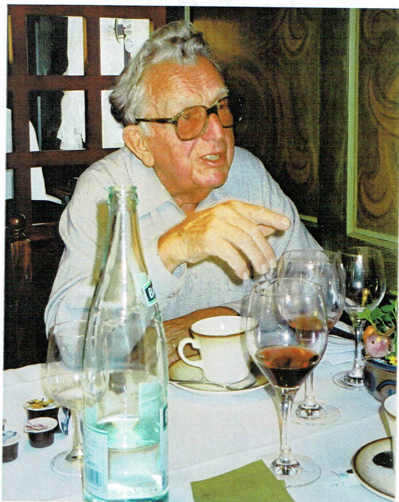
Blondel, der Pralinen - Restaurant