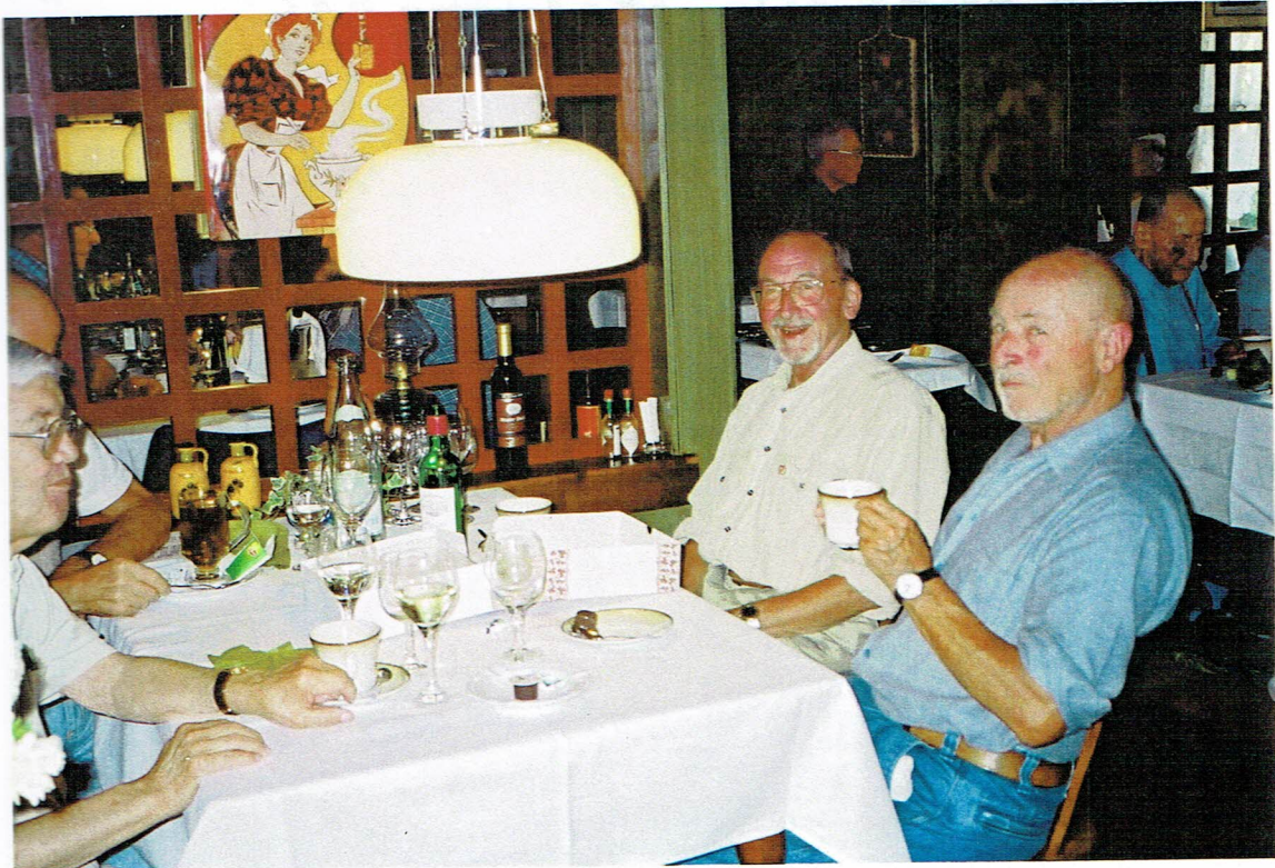
Die Brüder Fant und Quick, fang links der Psychiater Stück.