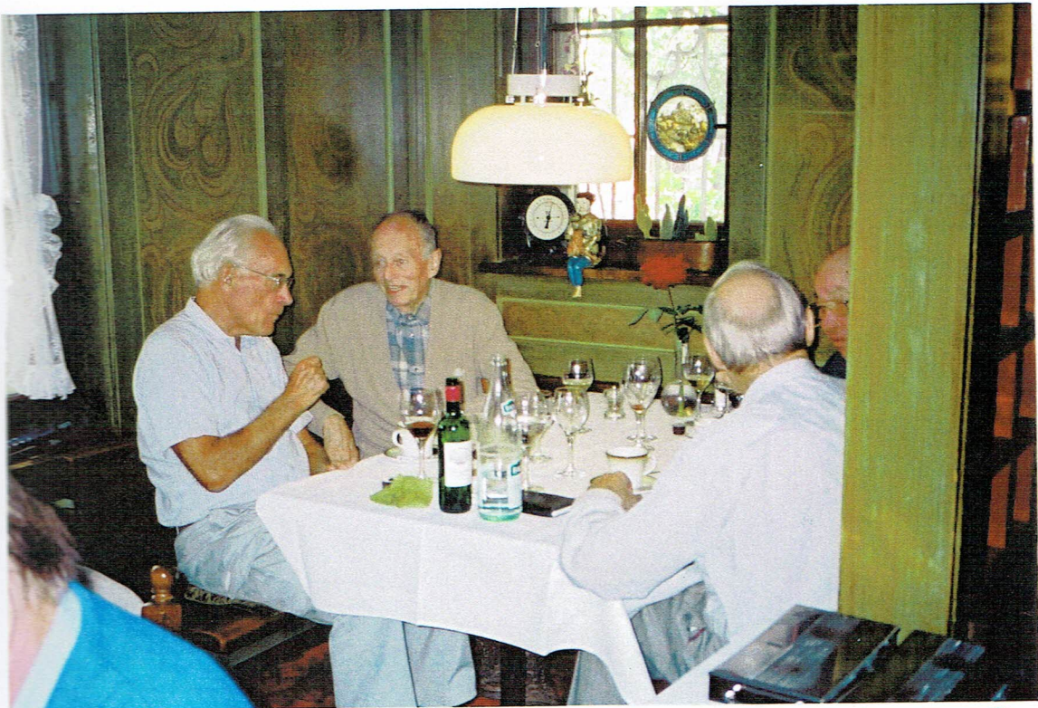
V.l.n.r. Schluck und Kett, Schinzel und Frank.