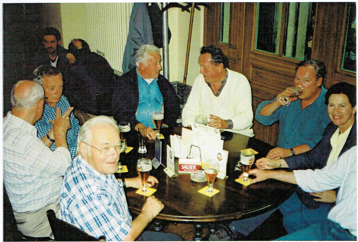
Die würdige Tafelrunde b.l.n.n.: Retik (b.hinten), Waldi, Quax (der Berichterstatter), Rumpel (der Spender), Romeo, Anthea und ein wenig Lynkens. Der Fotograf Moritz (unsichtbar).