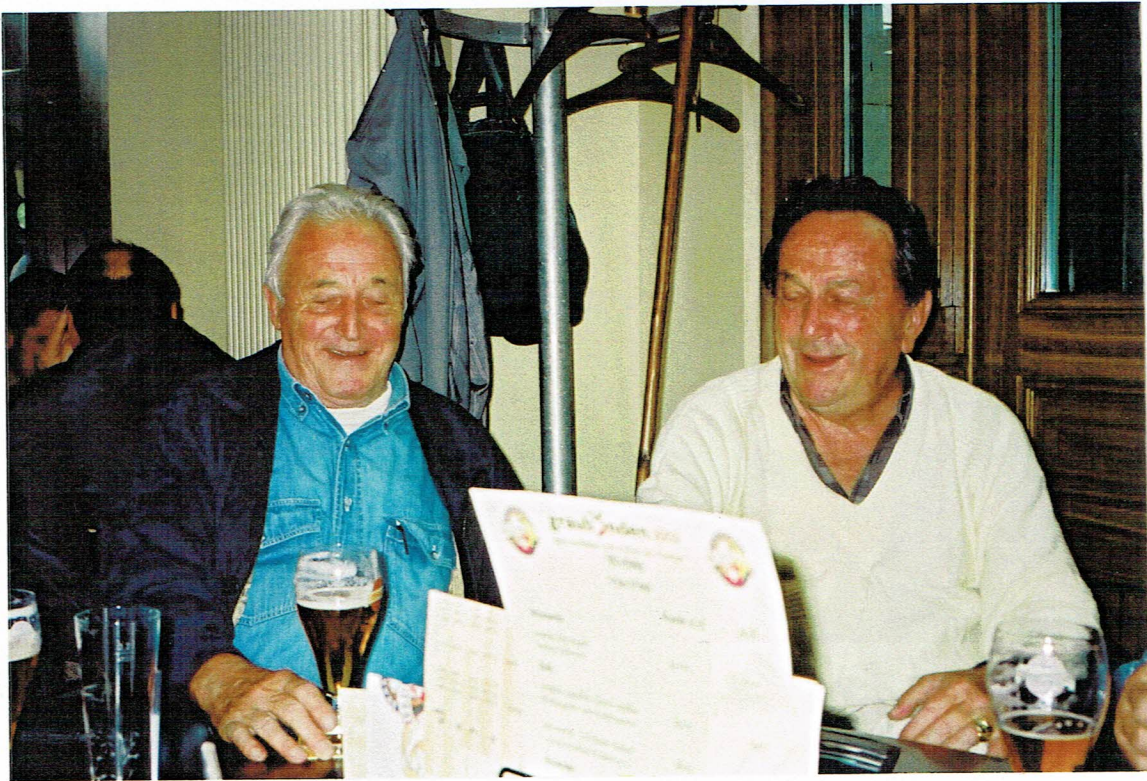
Der Leibzucker und sein Alter : Quax und Rumpel

Der Leibzucker und sein Alter Quax und Rumpel