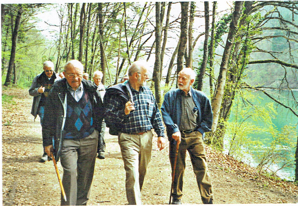
Hinter: Kalm Vorn v.l.n.r. Oepfel Kapp Forsu