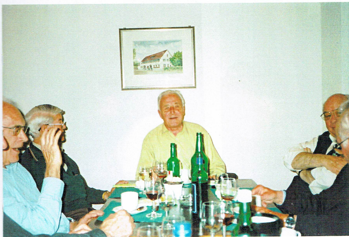
V.l.n.r.: Schluck, Frick, Quex, der Foto-graph mit altem Gesicht und neuem Kniegelenk, dann noch etwas Frank