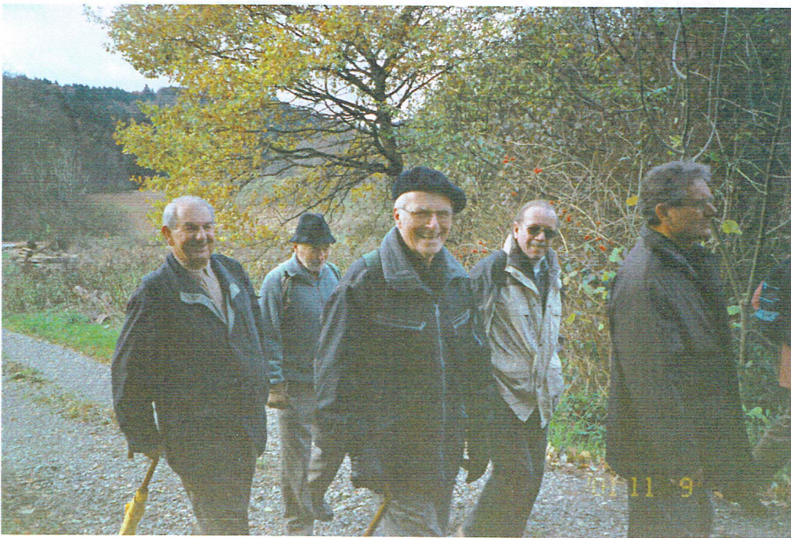
V. l. n. r. Lot, Quick, Harz, Christel, Sprint