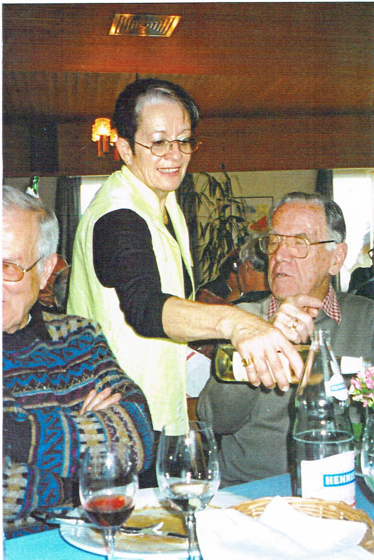
Handzeichen schafft Klarheit!