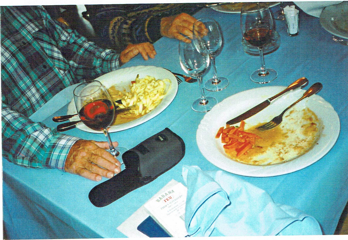
unterschiedliche Präferenzen: 'Riiebli' oder 'Nudeln?', das ist hier die Frage.