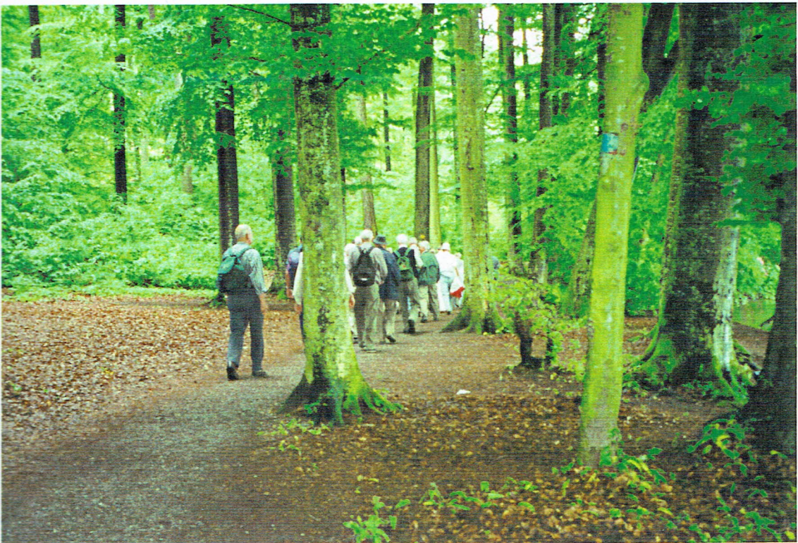
Ankige Fangart und ankige Gespräche im lichten Anwald.