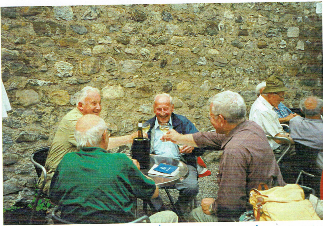
V.l.n.r. Quax, Ping-Pong, Patachon und Bison