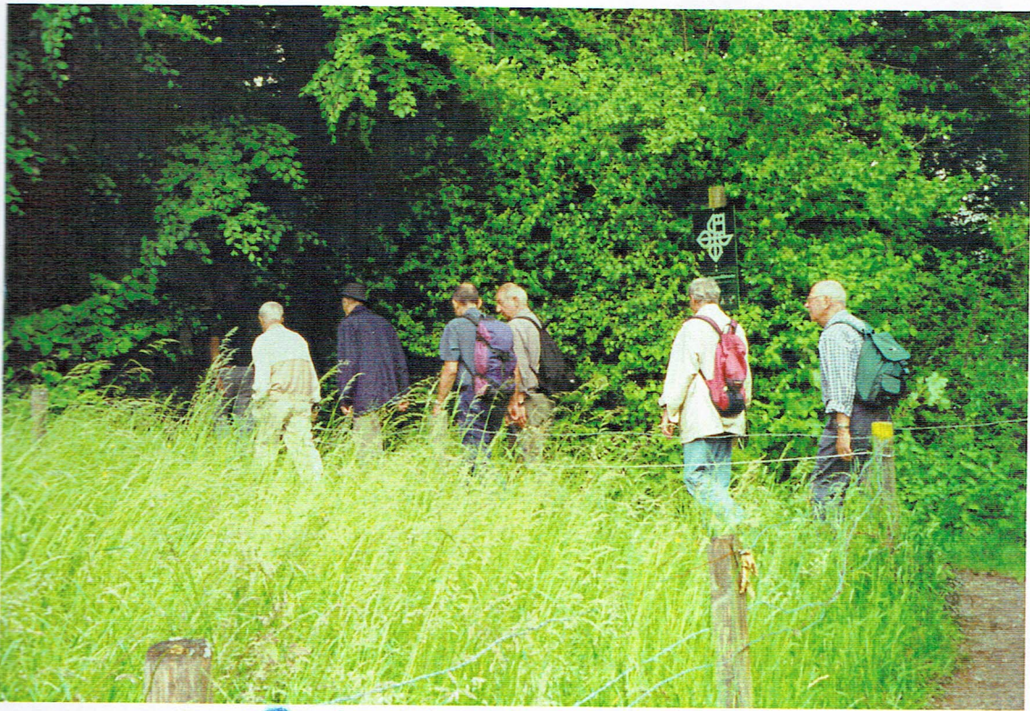
kleiner Strick, Kett, Meißig, Loz, Lynken und Kettich