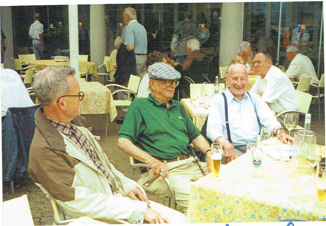
L. E. u. A. Cato, Ping-Pong, Patagon