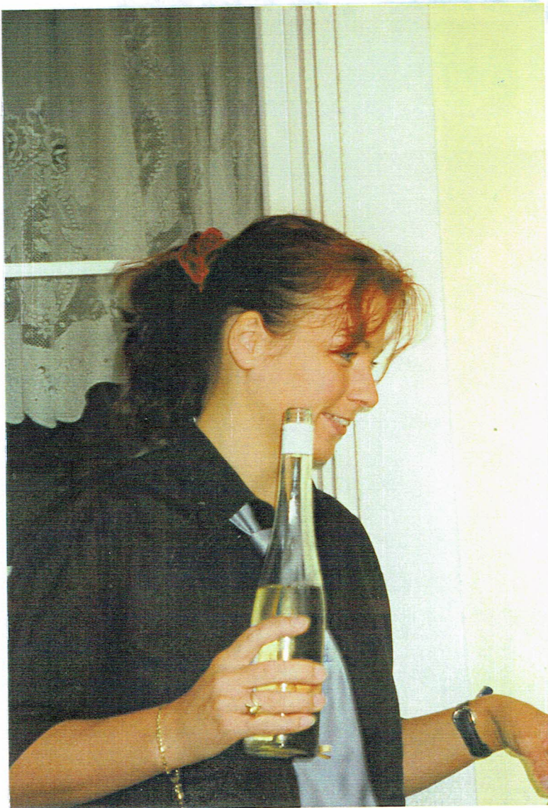
Das ist, natürlich den "Reser- legen" R x S.