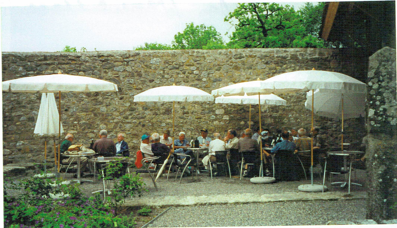
Kier die gesamte Corona im Hof des Schlosses Hallwil beim Abend schoppen.