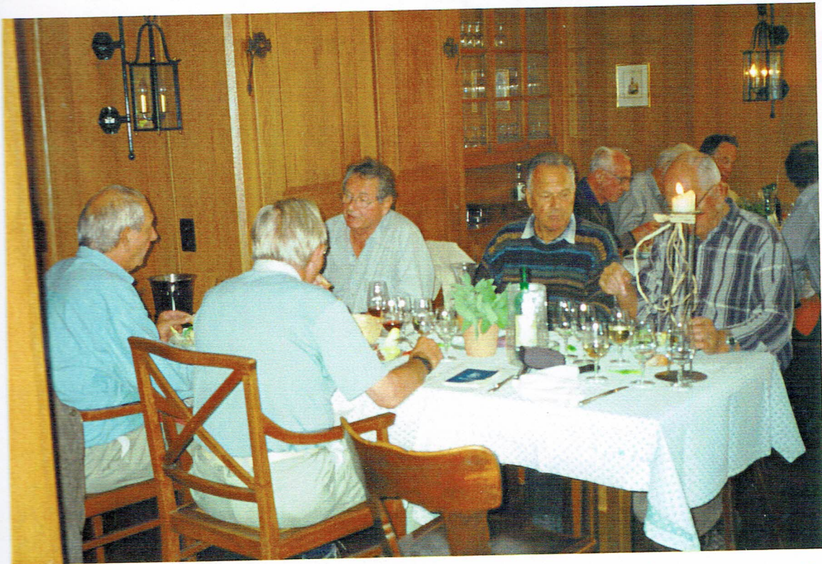
l.c.u.v. Lot, Oepfel, Sprint, Ulan, Rottich