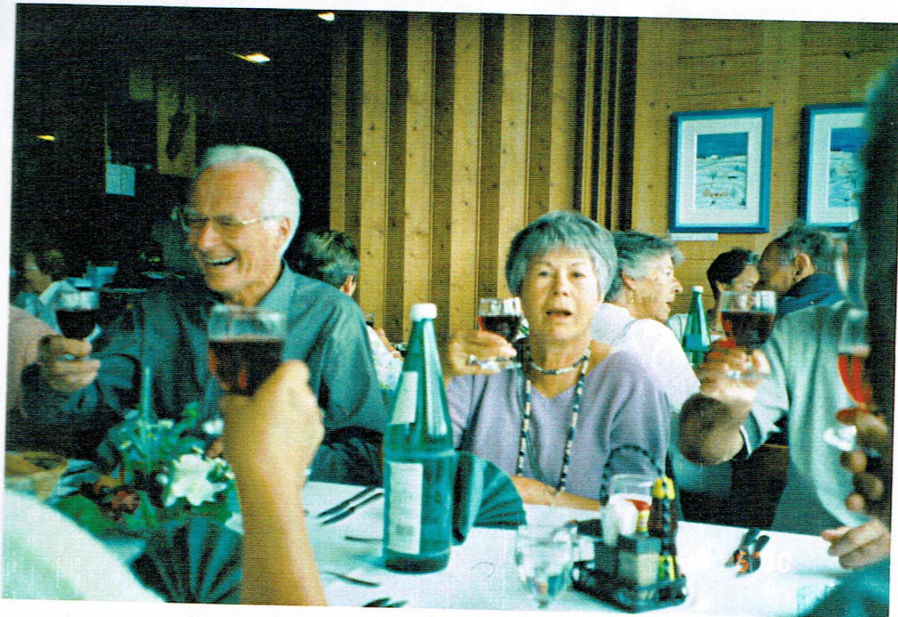
Karg, der Gerichter- Sticker