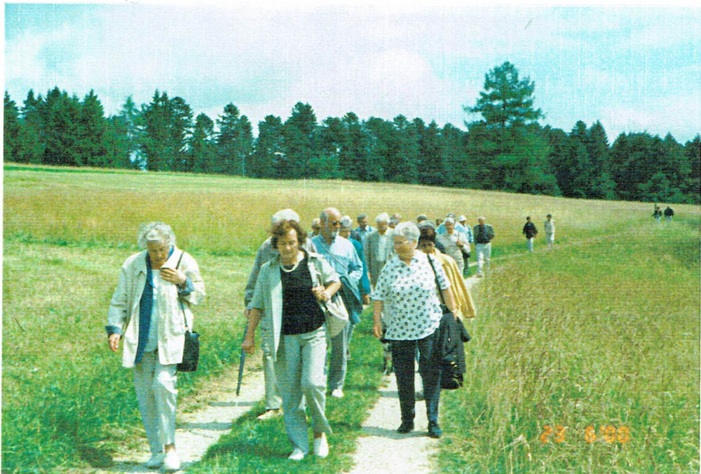
Bummel über das Feld