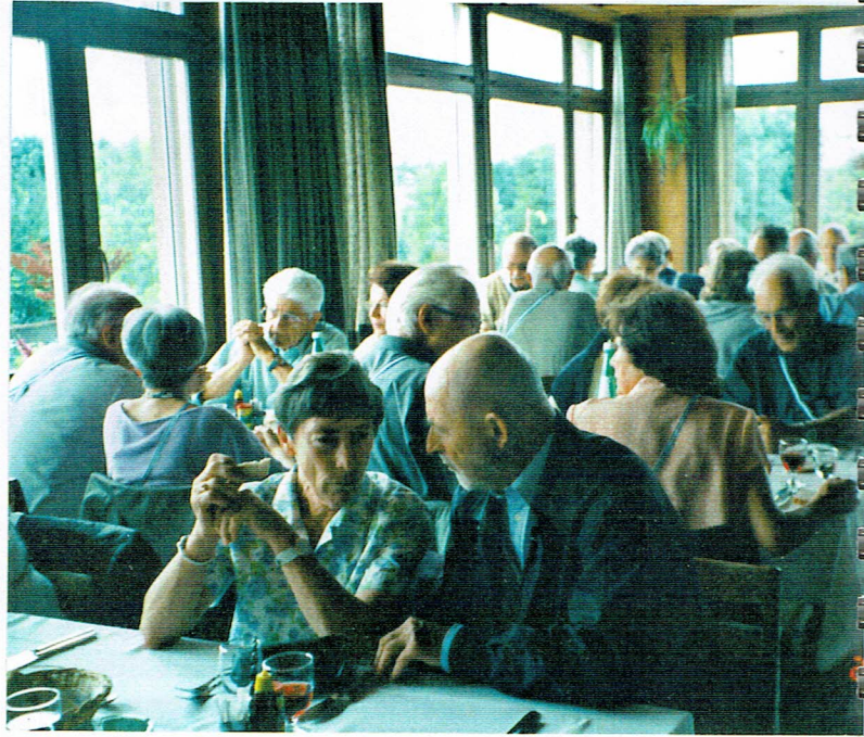
Die Organisatoren: Quick