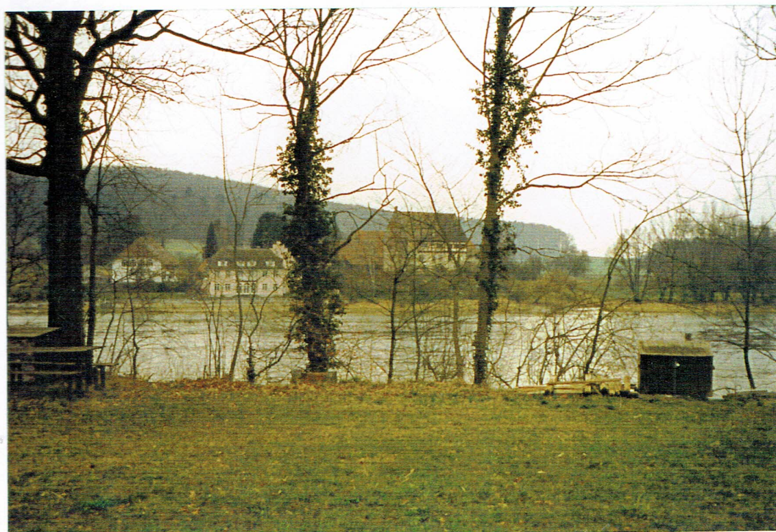
Ein herrlicher schöner Weg, der Rhein und drüber die „Tiber- mühle“.