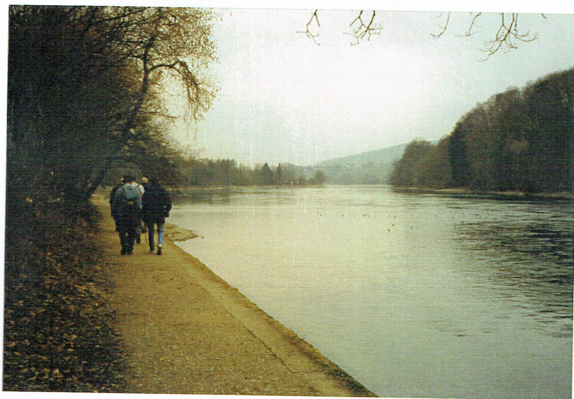
Endlich in der 'Krone'