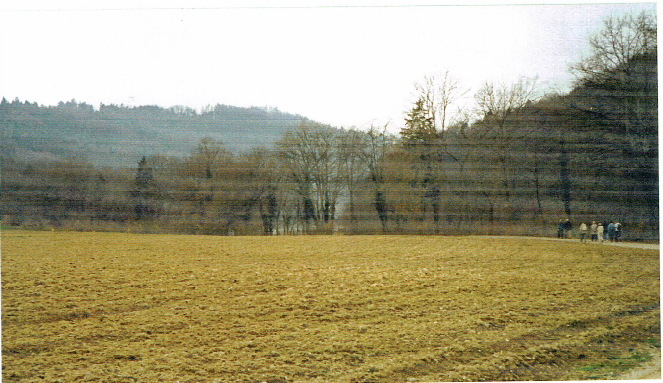
Keimat: Äcker, bewaldete Hügel und in der Ferne ahnt man den Rhein