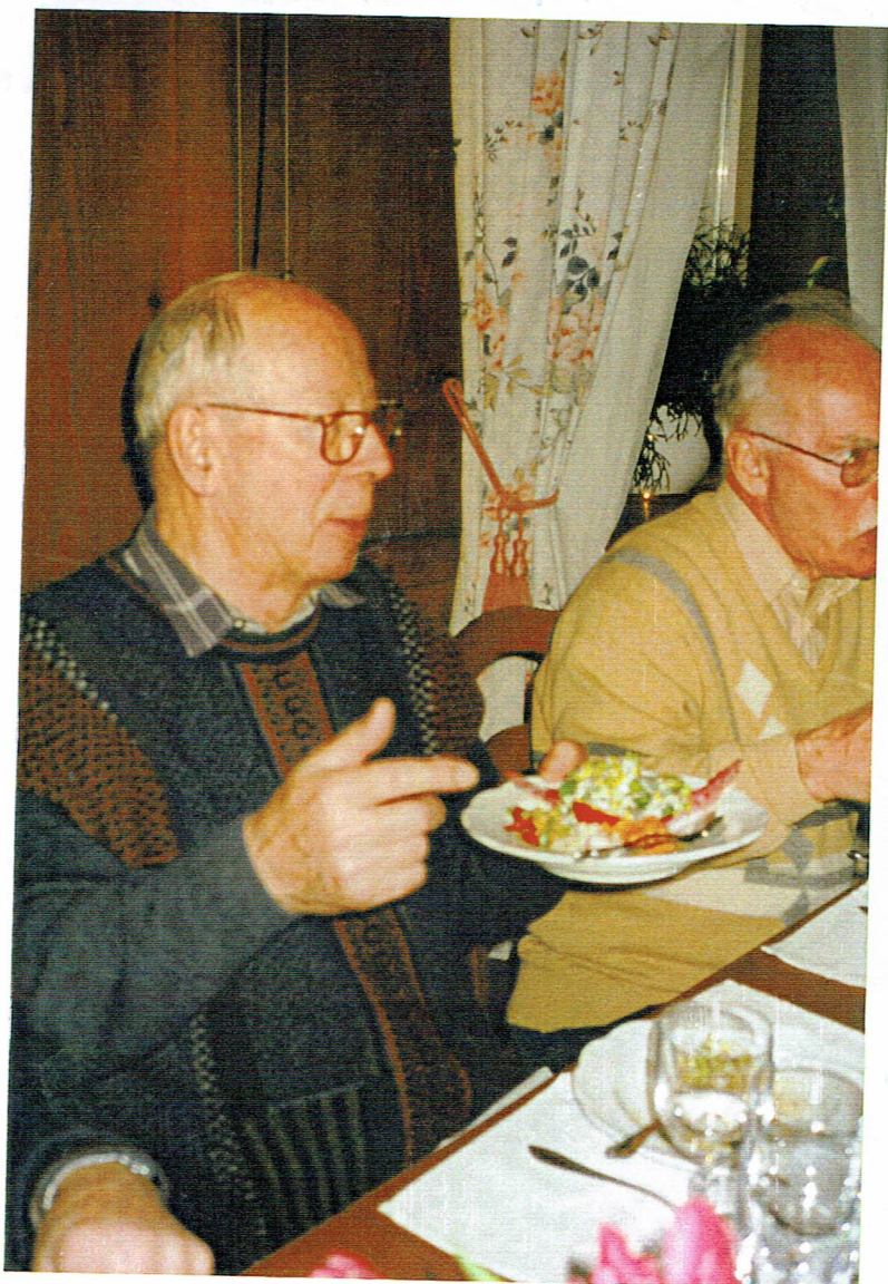
Netlich in Ek. stare ange sichts eines Tellers voll Chlorophyll und Vitaminen.