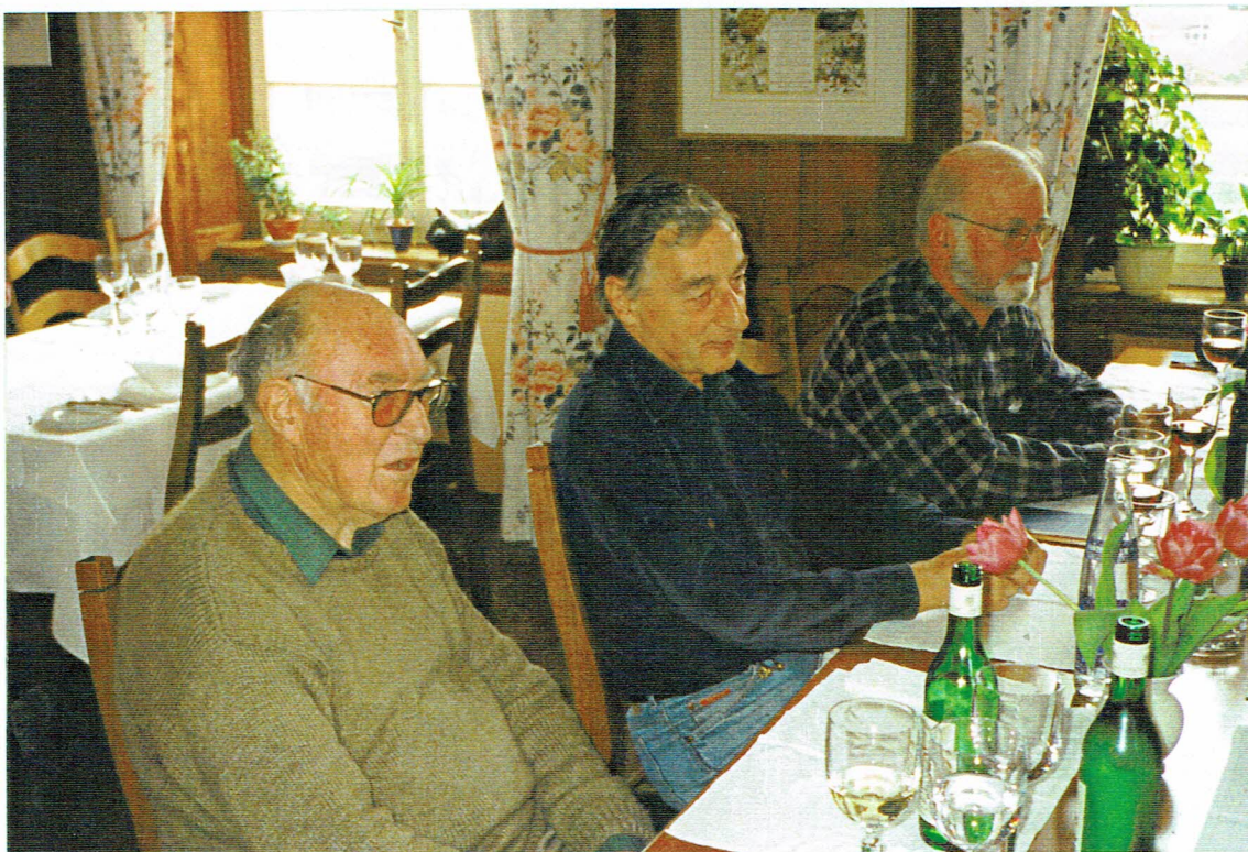
Die andere Seite der Corona: K.L.N.N. Krog, Maus, Käpf.