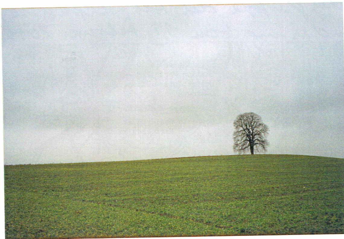
Nabe Horizonte im Raume berlingen.