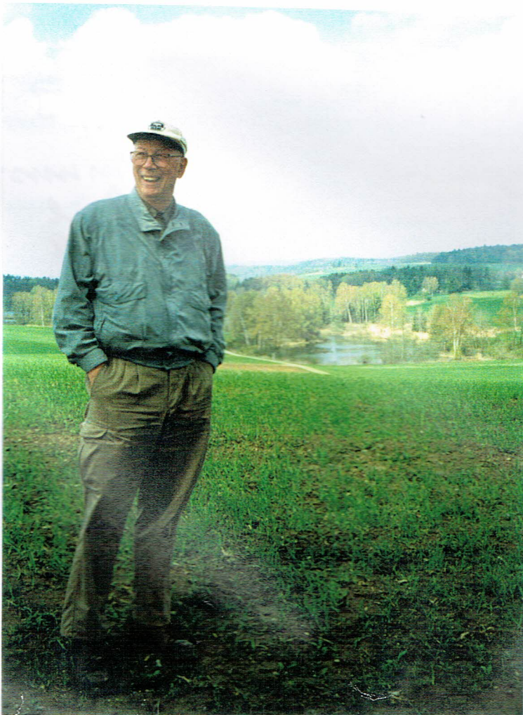
Nettlich vor dem Husenener-See