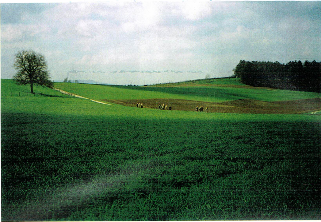
Die Wandergruppe in der Frühjahrs- landschaft integriert.