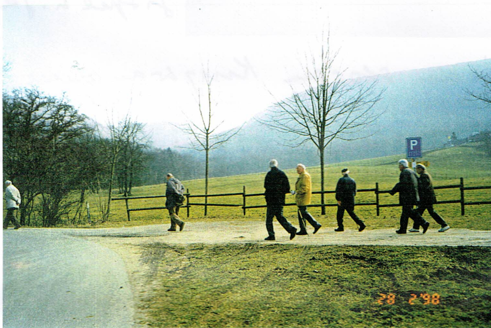
Eine Stunde später bekommen wir den Wald und befinden uns im Chrebsbach- Tal.