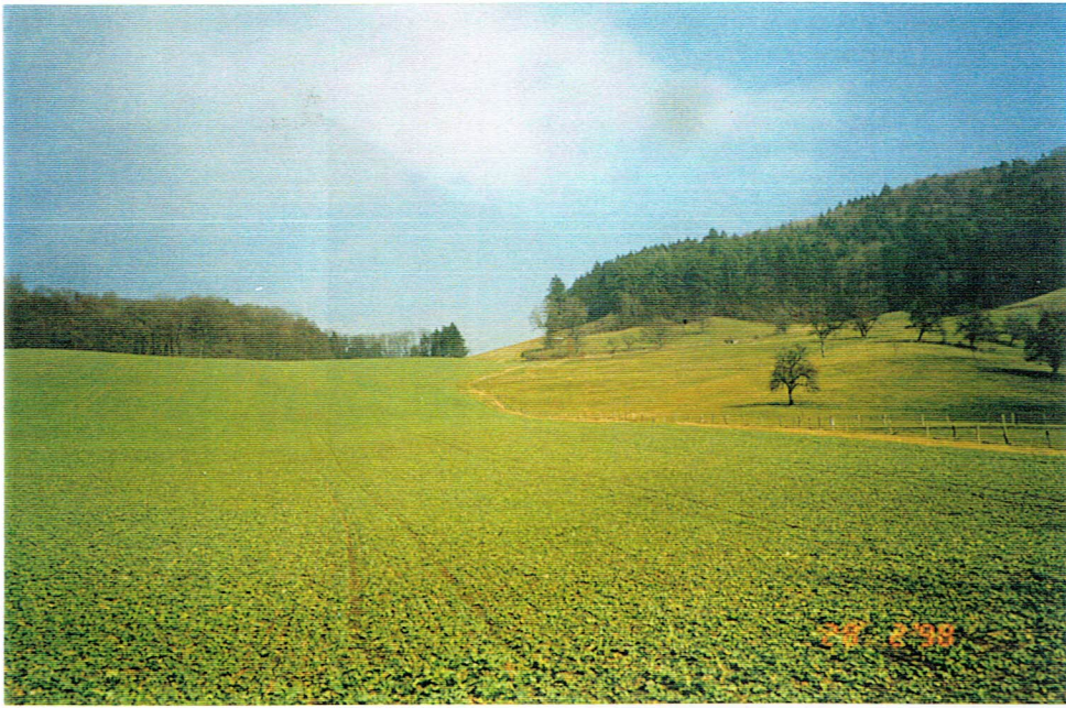
Aleg, Richtung Schleithen Jawan, Riebli, Ping-Pong