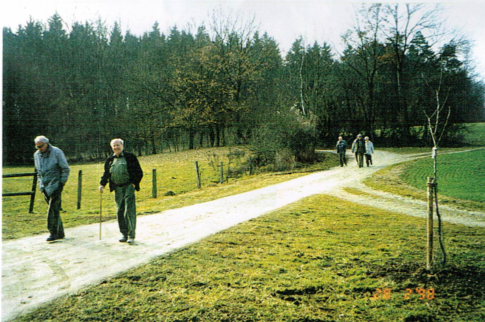
Pispel und Jawan