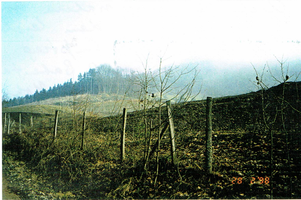
Am Rande 43 des Randen berührt sich der Nebel