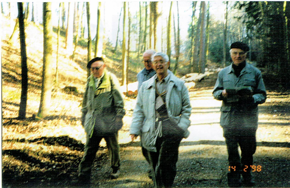
Lichter Winterwald am Worbis v.l.n.n. Koray, der Chef ½ Spiel Strick und