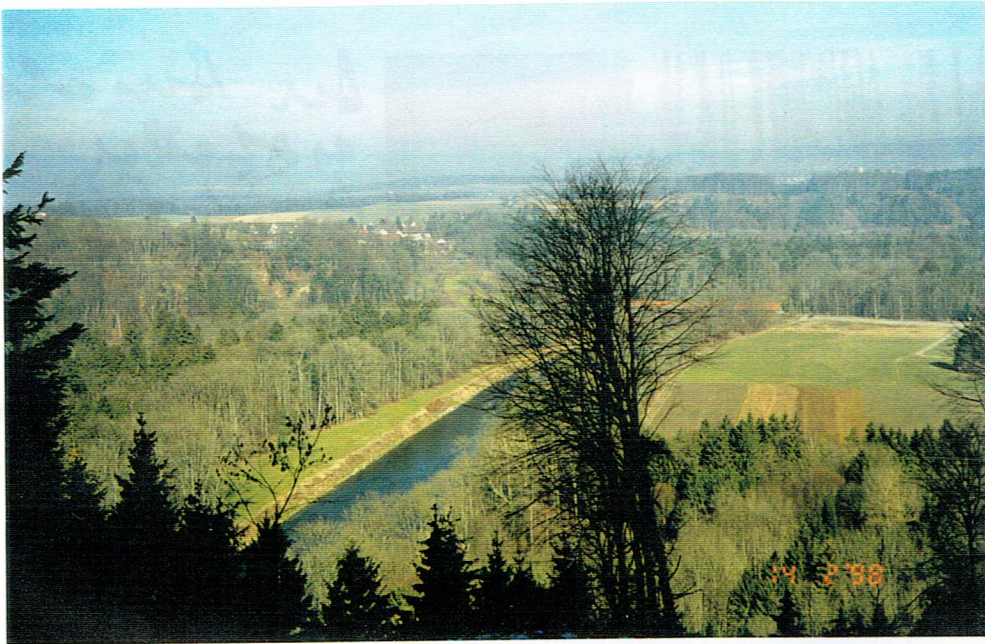
Ein Blick 32 hinunter ins Thuratal.