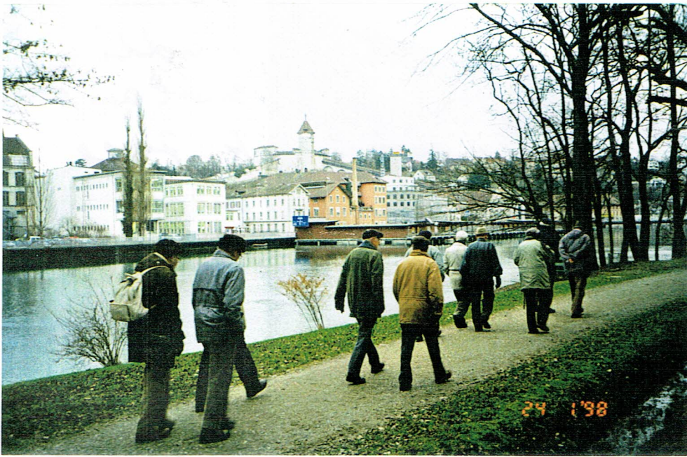
Mumoz und Badi: Das waren noch Zeiten!