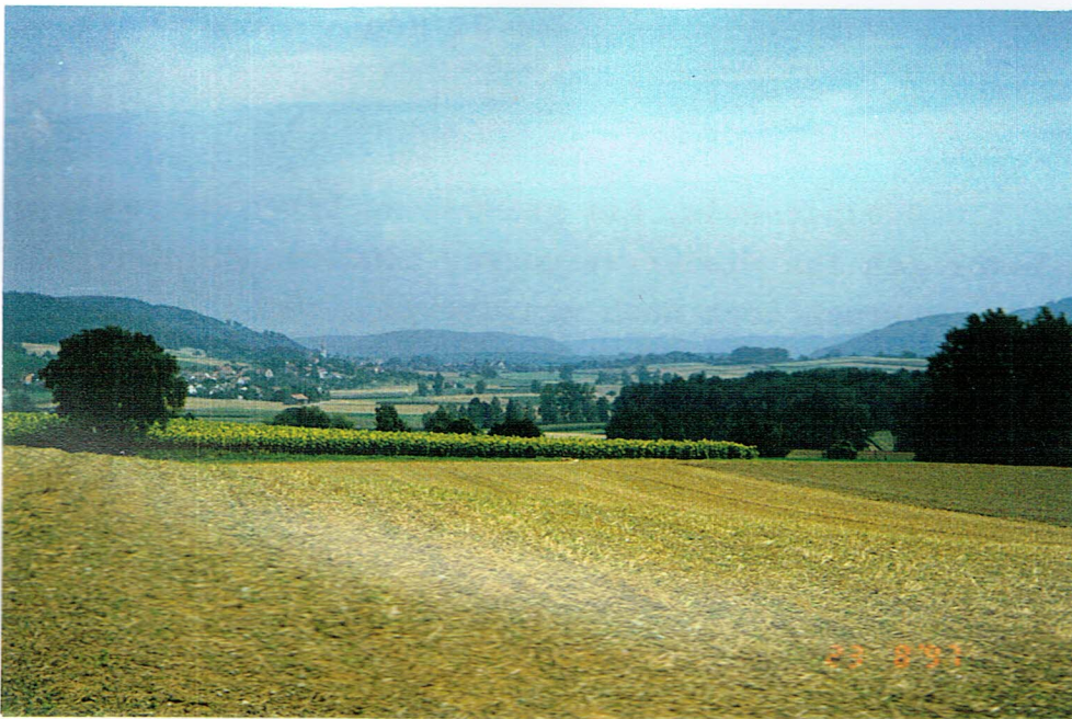
Ein letzter Blick R Brühl in der bei Hohen- klingern