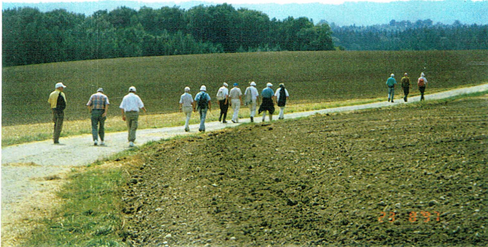
Lini bei - 19 Linsen Jannischau R. Bruch - thalen