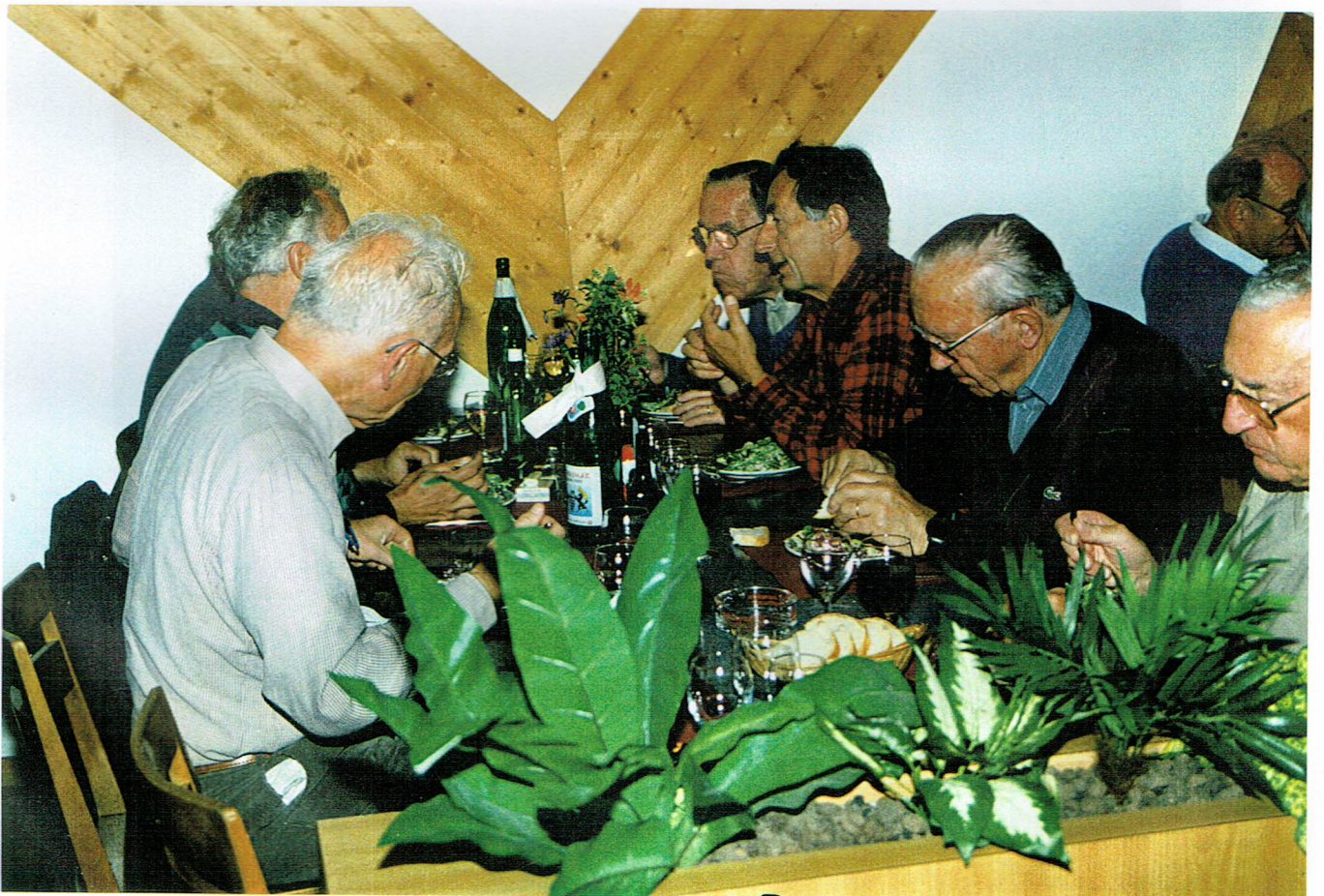
Hörnlimuns Oester, Rindl