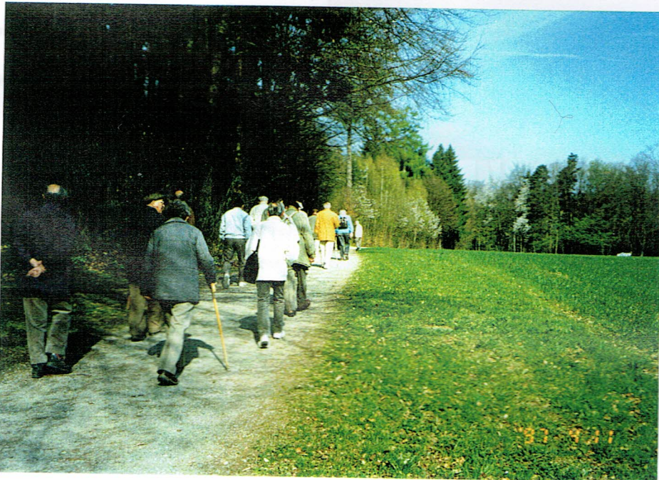
Wandergruppe beim Keimadpark