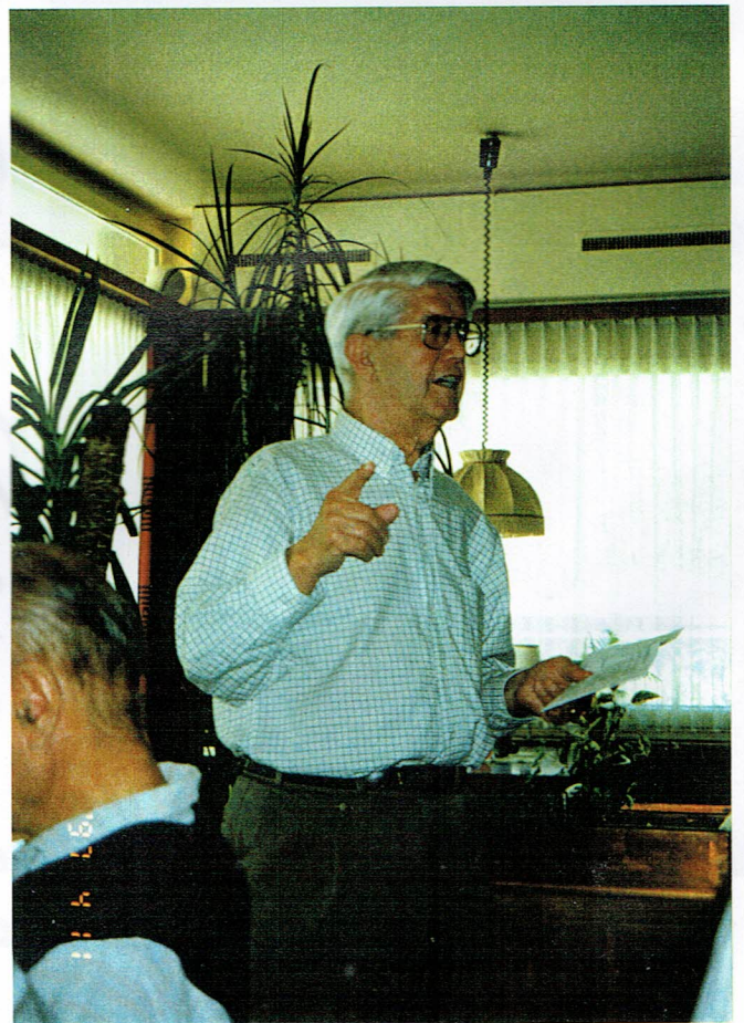
Sticks Kamp zur Symmetrie kulminiert in einem Echo von Schüttelreime (Kilose)