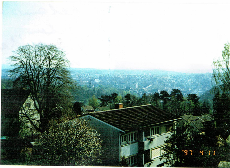
Blick über 37 unsere Keimad - Stadt