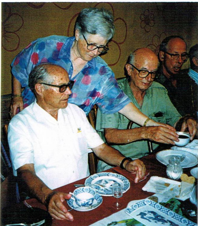
Unten: hab herzlichen Dank!