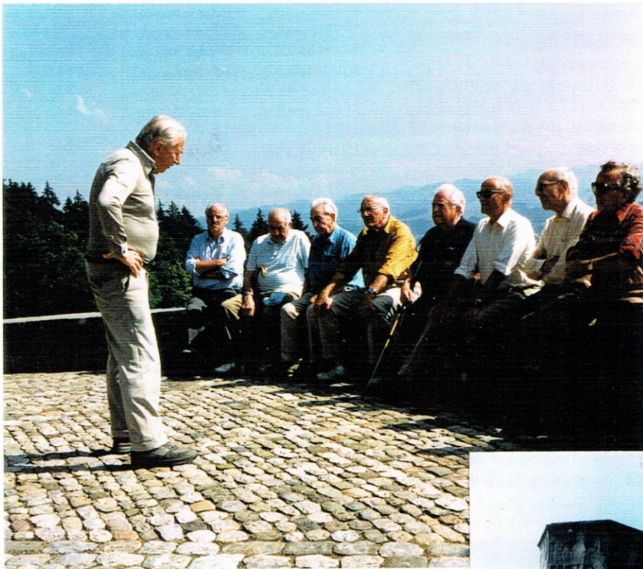
Chärstli erläutert die Bedeutung des Soldaten-Denkmal's uf der Lueg