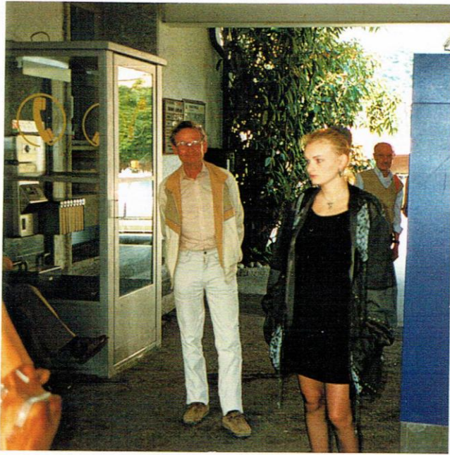
Spitz auf Ausguck