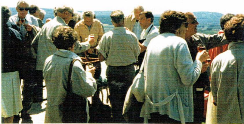
Trunk bei den Hallauer Anglikern