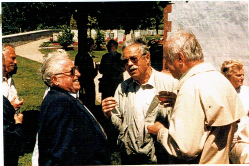
Lwig f6telicher Regel Ch6nster Pardel