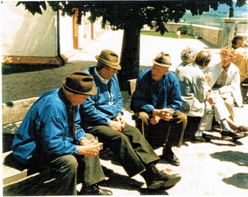
und Pulver haben auch.