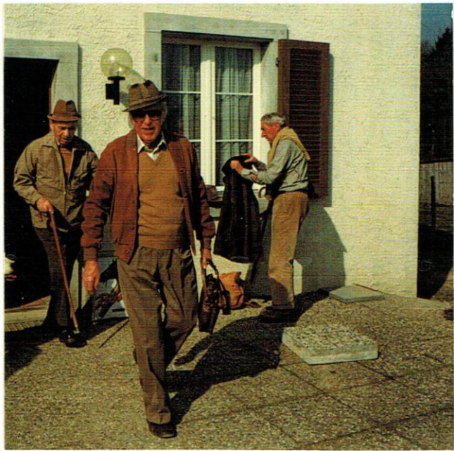
Kilbitz Rost Profil