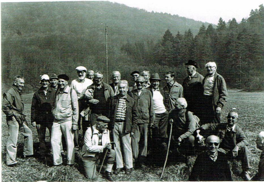
im Wangental vor Rossberg 11.3.83